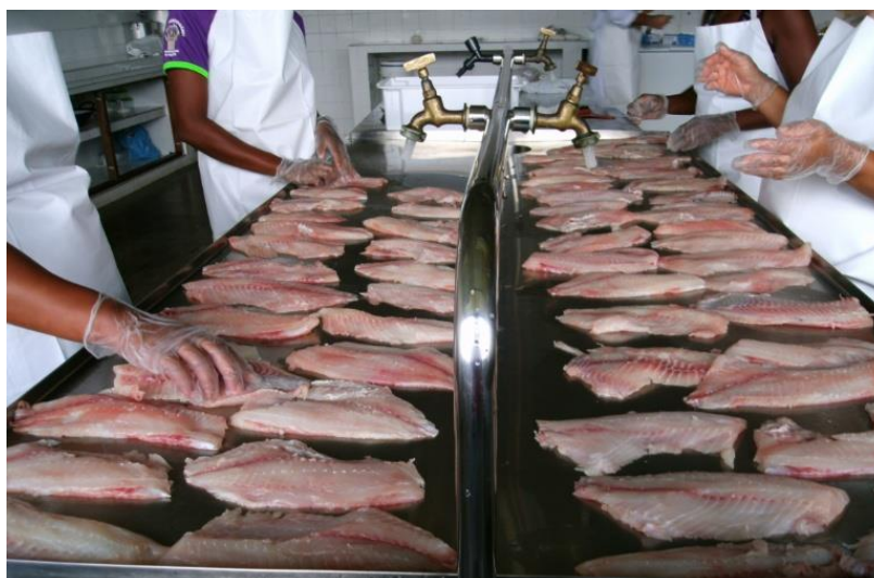
FIGURA 1: Beneficiamento do pescado

A divisão sexual do trabalho está visivelmente presente, por exemplo, na mariscagem. Na comunidade de Batateira, no município de Cairú (BA), pesquisada por Esteves (2007), cabe aos homens apreenderem caranguejos visto ser uma atividade mais rentável e que exige maior força física; já as mulheres dedicam-se à extração de lambreta por ser um trabalho mais leve. Similarmente ocorre na comunidade de Mangue Seco, em Valença (BA), onde as Marisqueiras raramente apreendem caranguejos; dedicam-se, entretanto à captura de mariscos como sururu e ao beneficiamento do siri, do camarão e pescados diversos (figura 1). “Essas especializações definidas pela divisão do trabalho se fazem com base nas características físicas de força e crenças a respeito da fragilidade e vulnerabilidade das mulheres, sobretudo” (ESTEVES, 2007, p. 84).