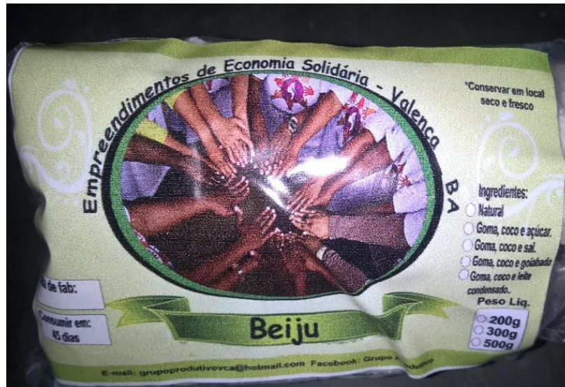
FIGURA 2: Produto comercial