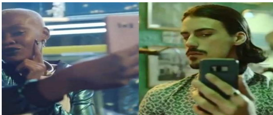
FIGURA 1- Parte da peça publicitária do Banco do Brasil que foi vetada pelo presidente Jair Bolsonaro (2019) 24