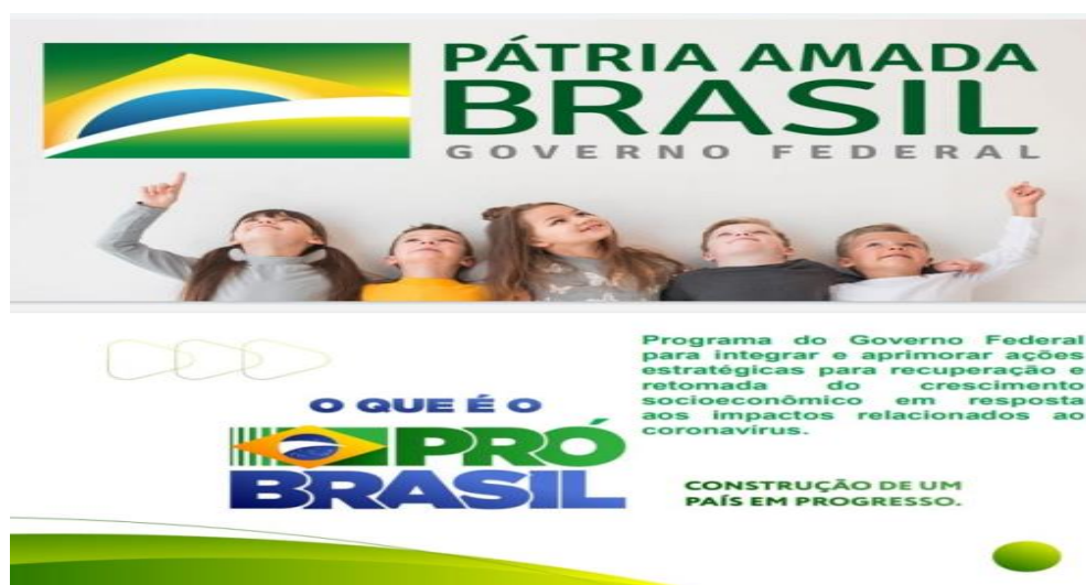
FIGURA 2 - Peça publicitária do governo do presidente Jair Bolsonaro usada para divulgar o programa Pró-Brasil (2020) 25