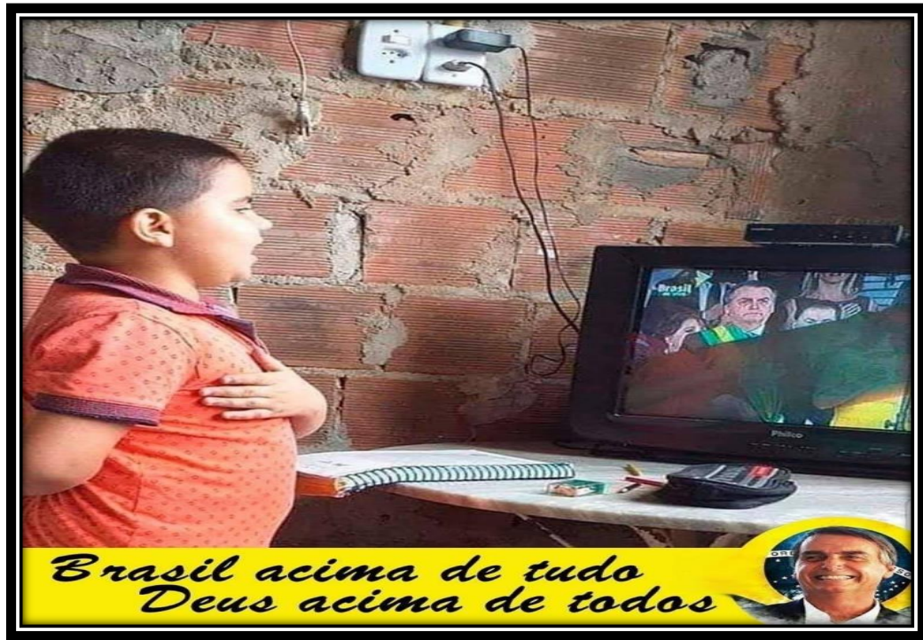
FIGURA 3 - Material de Campanha de Jair M. Bolsonaro

Fonte: Imagem publicada na conta do presidente da República no Twitter 47