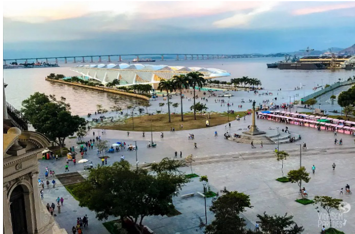
Figura 3: Boulevard Olímpico e o Museu do Amanhã pós-jogos

A principal construção, no entanto, foi o Boulevard Olímpico no Rio de Janeiro, dividido em duas regiões principais: Porto Maravilha, que vai dos armazéns do porto até a Praça Mauá, e Orla Conde, que se estende da Praça Mauá até a Praça XVI. A área abrange toda a orla da região central, incluindo bairros como Centro, Gamboa e Saúde. O Boulevard Olímpico tem uma extensão de aproximadamente 3,2 a 3,5 quilômetros. É um local com muitas atrações turísticas e culturais que pode se fazer à pé e estende ao longo da orla entre a Praça XV e o AquaRio, passando por locais históricos e culturais como a Praça XV, a Praça Mauá, o Museu de Arte do Rio (MAR), construído em 2013, e o Museu do Amanhã, em 2015 (Figura 3 e 4), Mural Etnias do artista Eduardo Kobra, um dos maiores murais de grafite do mundo (Figura 4) 6 , AquaRio e a Roda Gigante RioStar (considerados os maiores da América Latina).