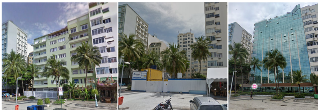
Figura 2: Mudança estética de edificação na Avenida Atlântica, nº 324 em 2010, 2013 e 2022.