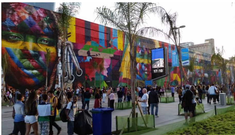
Figura 4: Mural Etnias do artista Eduardo Kobra