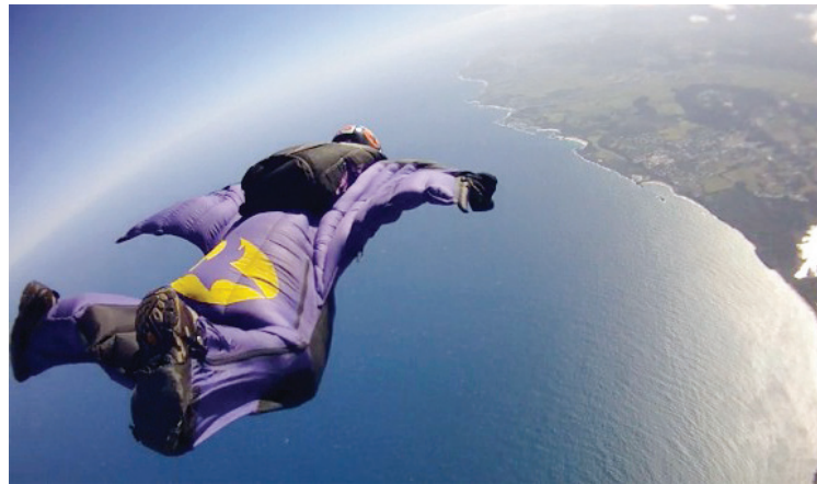
Humano vestido para voar.