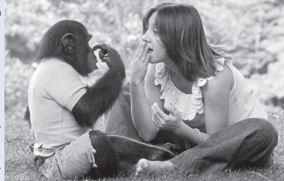
O chimpanzé Nim Chimpsky e uma cuidadora conversam na língua de sinais. Disponível em:

http://www.nytimes.com/2011/07/08/movies/project-nim-about-a-chimpanzee-subjected-to-research-review.html?_r=0