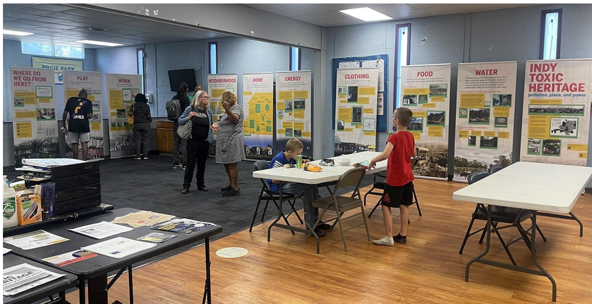
Exposição do Indy Toxic Heritage no Parque Pride, em Indianápolis. Agosto de 2024.

De acordo com Ševčenko (2024), um projeto participativo de memória pública voltado para a justiça climática precisa atuar de forma translocal, destacando as histórias específicas de comunidades na linha de frente e conectando-as a forças estruturais mais amplas que moldam essas vivências. Essa abordagem translocal permite integrar reivindicações locais de reparação em campanhas nacionais ou globais de duas maneiras principais. Primeiramente, ela estabelece uma base de solidariedade e apoio entre comunidades, aproveitando o reconhecimento nacional para pressionar as autoridades locais. Mais importante, ao conectar experiências locais a histórias compartilhadas nacional e globalmente, fortalece-se a base para reivindicações de reparação, demonstrando que as desigualdades atuais não são causadas por falhas individuais ou por condições isoladas, mas estão enraizadas no racismo estrutural do capitalismo global. A autora cita que: