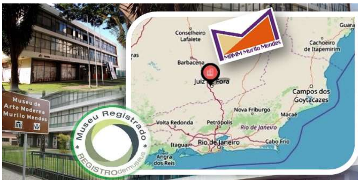
Figura 1 – MAMM localização geográfica e característica externa da edificação