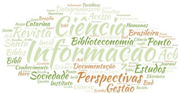
Figura 1: Nuvem de tags dos títulos de periódicos

Os dados também podem ser observados através de uma nuvem de tags , como segue (Figura 1):