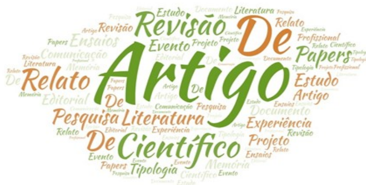
Figura 2: Nuvem de tags da tipologia dos textos publicados

Os dados também podem ser observados através de uma nuvem de tags , como segue (Figura 2):