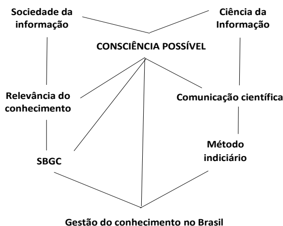
Figura 1 - Rede conceitual na presente abordagem

Wersig (1993) desenvolve sua “rede” a partir da ideia de uma mudança real no papel do conhecimento para indivíduos, organizações e culturas. E, a partir desse modelo, tecemos, no presente trabalho nossa rede conceitual, usando o conceito de “consciência possível” como <atrator> para reunir fios conceituais no tear da Ciência da Informação, entrelaçando a trama em um contexto com o qual abordamos a emergência da “gestão do conhecimento” como temática no território da literatura da área, no Brasil (Figura 1).