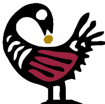
Figura 1 - Sankofa

A entrevistada menciona em sua fala a Sankofa, cujo simbolismo significa “Aprender com o passado, construir sobre as fundações do passado” (Nascimento, 2021, p. 125). Este ideograma faz parte de um conjunto de símbolos denominado Adinkra, que se caracteriza pela imagem de uma ave que voa para frente tendo a cabeça voltada para trás, segurando um ovo com o bico. Segundo o artigo publicado por Leite (2021) no Portal Geledés, o símbolo “surgiu com o provérbio ganês “ Se wo were fi na wosankofa a yenkyi ” que significa “não é tabu voltar para trás e recuperar o que você esqueceu (perdeu)”.