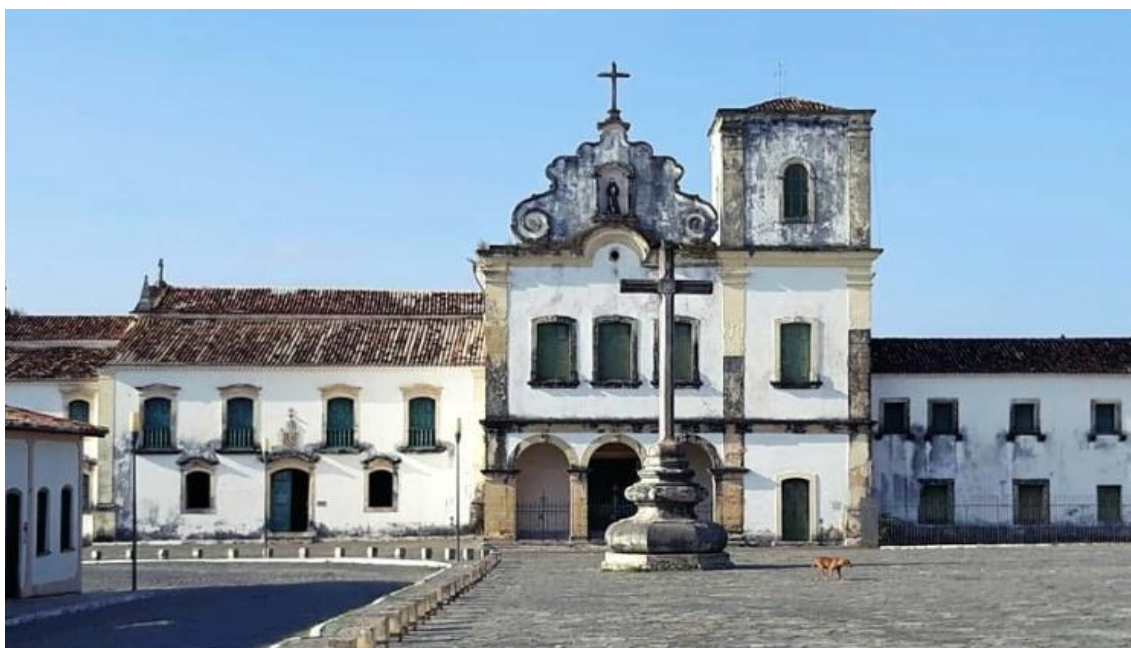
Museu de Arte Sacra de São Cristóvão – SE

Revista mantida por grupos de pesquisa em História sediados na Universidade Federal do Rio Grande do Norte (UFRN), na Universidade Federal de Sergipe (UFS) e na Universidade Regional do Cariri (URCA), especializada na publicação de artigos de revisão e resenhas de livros de História e Memória.