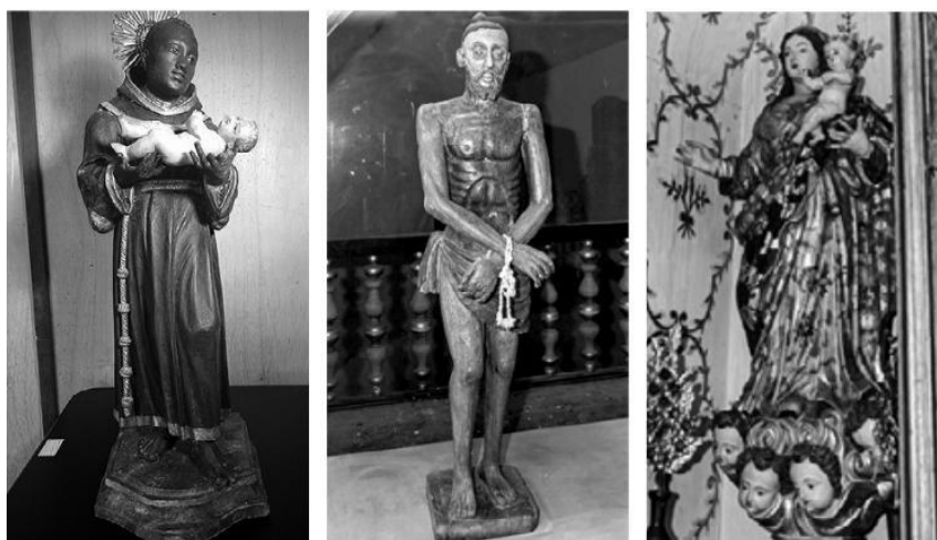
Imagens do acervo do MASC: São Benedito, foto de Marcelo Santos, Jesus Atado e Nossa Senhora do Rosário, foto de Alan Santana | Imagens: (Santos, 2021, p.13-14 e p.28)

Dessa maneira, por meio do itinerário citado e o uso de diversas imagens, como as de Nossa Senhora da Boa Morte, Nossa Senhora do Rosário e São Benedito é possível uma reflexão sobre a memória e a história da população negra que viveu em Sergipe. Com essa medida, ele problematiza o dominante discurso sobre a homogeneidade da identidade religiosa dos sergipanos, apesar de, em alguns momentos do livro, restringir a população negra que residia em São Cristóvão.