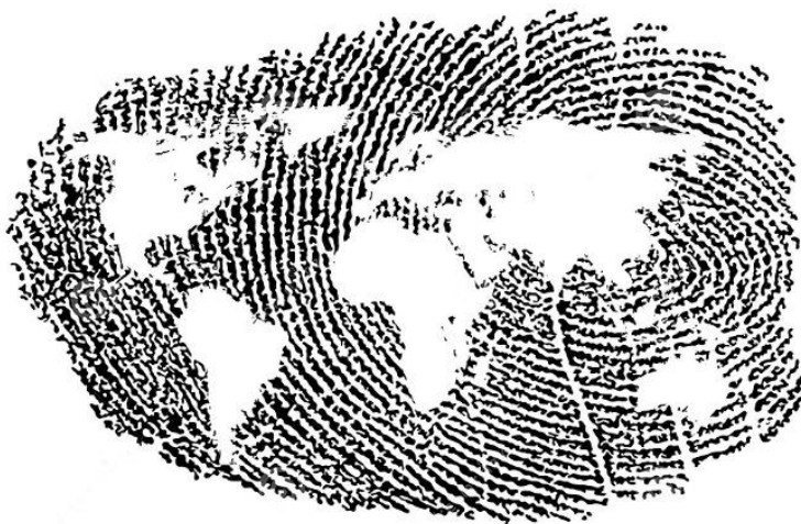
Impressão digital do mundo.

Como conclusão principal, vale destacar a sua afirmação de que os recursos digitais são grandes aliados na promoção e multiplicação do conhecimento, na medida em que favorecem o contato entre saberes, ideias, acontecimentos e pessoas para além das barreiras físicas e temporais, permitindo a comunicação em múltiplas linguagens e incentivando troca de conhecimento que conduzem a uma aprendizagem significativa; na mesma esteira, favorecem a democratização do ensino.