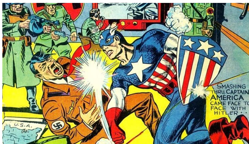
Na primeira aparição do Capitão América (1/03/1941), uma série de jovens se alistam no exército norte-americano para combater os nazistas que estão camuflados entre as fileiras norte-americanas | Imagem: Joe Simon, Jack Kirby Marvel/ El País

Comentando sobre as diversas revistas que falam sobre o assunto e a forma que lidam com ele, o terceiro texto – “O Holocausto nas Histórias em Quadrinhos”, de Victor Callari – traz as representações desse acontecimento histórico e o esquecimento que ele vem sofrendo. O autor disserta sobre a importância do estudo do Tempo Presente e das representações de narrativas sobre o passado em quadrinhos, declarando que a Segunda Guerra Mundial se torna cada vez mais distante das novas gerações.