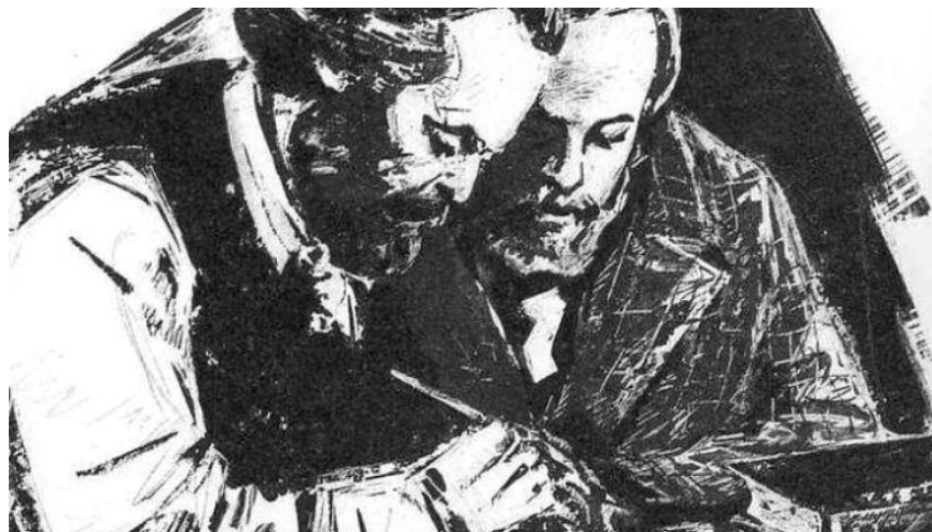
Karl Marx e Friedrich Engels – teoria e prática sempre andaram juntas

declarando que teóricos das Ciências Humanas têm buscado rever pontos da teoria do materialismo histórico para examinar questões que afligem as sociedades contemporâneas.