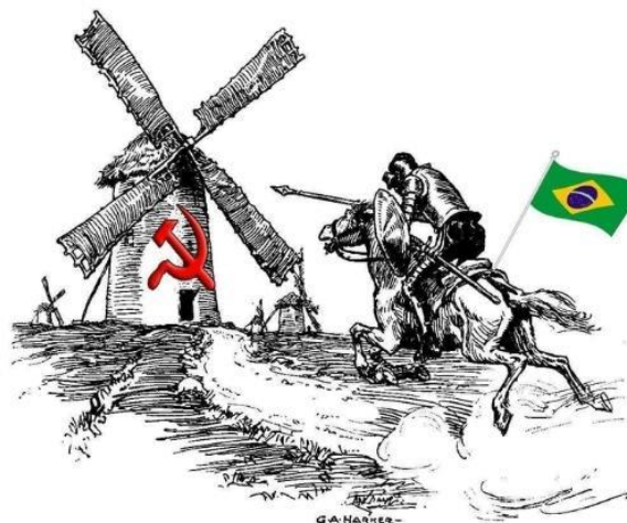
[Fascismo quixotesco] Desenho de G. A. Harker | Imagem: Casa de Vidro

A vitória de Bolsonaro, por fim, resulta de uma conspiração que emprega teorias da conspiração como meio, a exemplo de boatos, criação de um “inimigo imaginário”, fixação na caça ao “inimigo”, ao “comunismo”, e na ideia de que ele quer destruir a “família” e a “nação” (Bentivoglio; Brito).