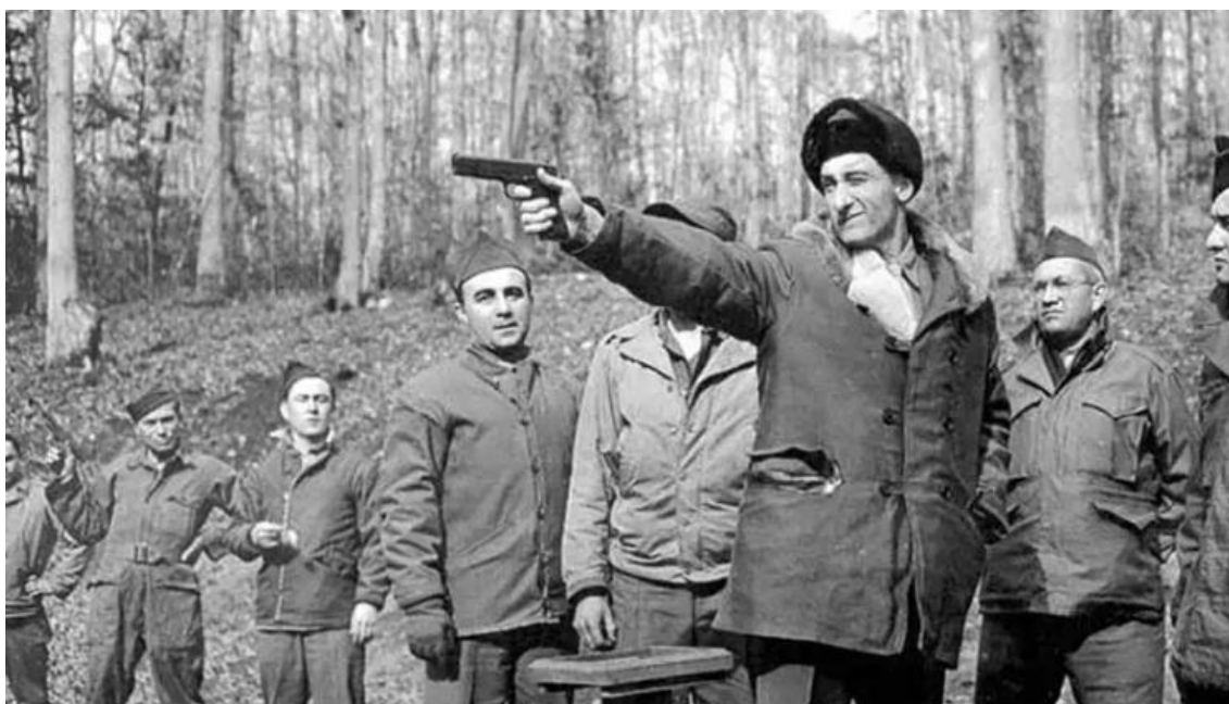
Candidates for the Office of Strategic Services (OSS) train at Prince William Forest Park, Va.

Revista mantida por grupos de pesquisa em História sediados na Universidade Federal do Rio Grande do Norte (UFRN), na Universidade Federal de Sergipe (UFS) e na Universidade Regional do Cariri (URCA), especializada na publicação de artigos de revisão e resenhas de livros de História e Memória.