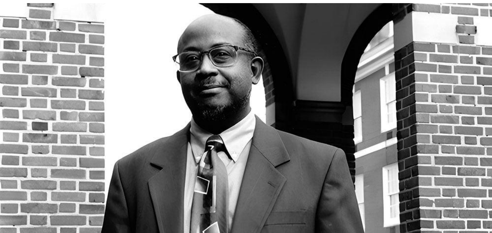
Michel-Rolph Trouillot

Revista mantida por grupos de pesquisa em História sediados na Universidade Federal do Rio Grande do Norte (UFRN), na Universidade Federal de Sergipe (UFS) e na Universidade Regional do Cariri (URCA), especializada na publicação de artigos de revisão e resenhas de livros de História e Memória.