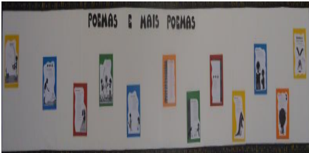
Figura 3 – O negro nos poemas