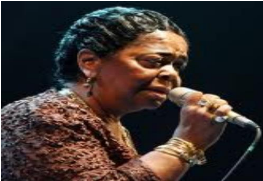
Figura 6 – Cesária Évora