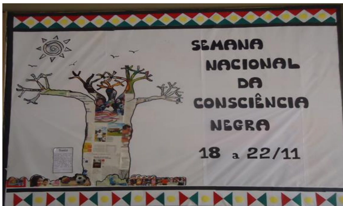
Figura 1 – Painel de entrada