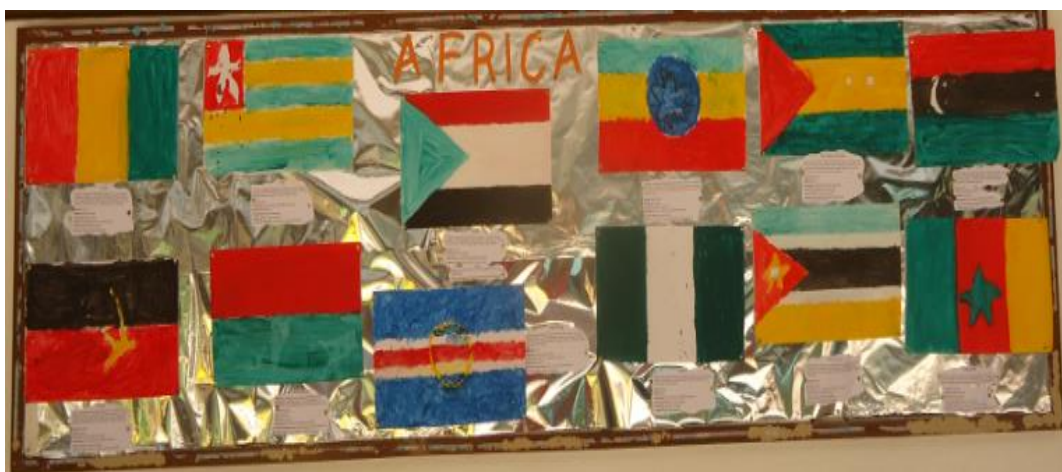
Figura 2 – Bandeiras dos países africanos