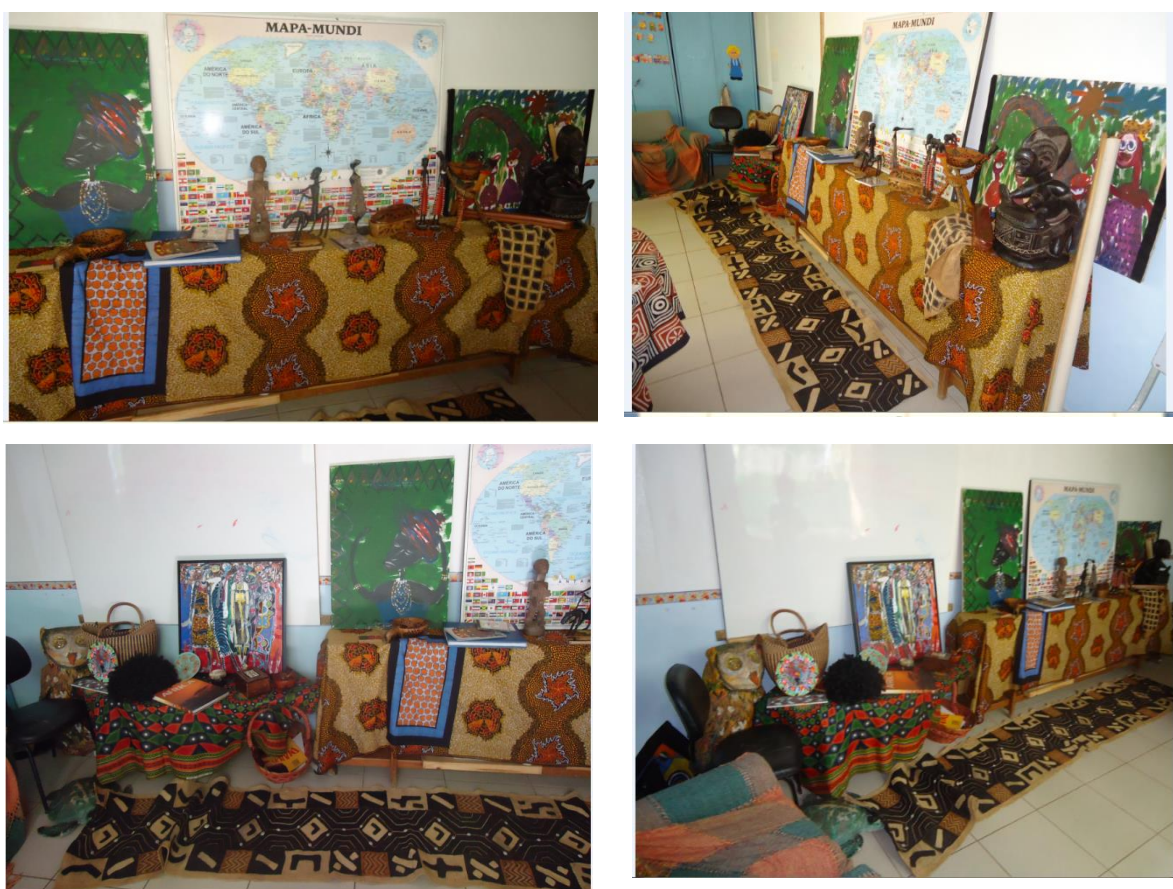
Figura 5 – Fotos da exposição África