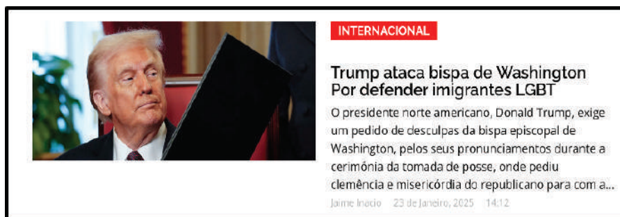
Figura 3- Notícia do ataque de Trump a bispa de Washington

Essa reeleição pode ser entendida como a razão da associação da imagem com a notícia apresentada acima, em que se verifica o presidente Donald Trump com as mãos abertas em sinal de receptividade e com sorriso estampado no rosto. A seguir, na Figura 3, apresentamos outra notícia veiculada pelo mesmo jornal “O país”, sobre as decisões tomadas pelo presidente Donald Trump após a tomada de posse.