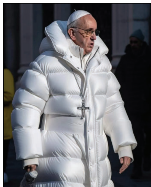
Figura 5- Imagem falsa criada por IA