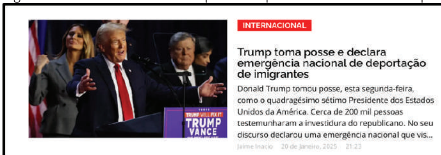
Figura 2- Notícia da tomada de posse do presidente Donald Trump

Desse modo, ao se apresentar um artefato, com o objetivo de atender uma determinada demanda, um estudante com formação em matéria voltada para o trabalho com a edição, poderá, de forma fácil, inferir sobre os significados e as intenções comunicativas da materialidade. Todavia, esse trabalho formativo, parece que não ocorre na educação básica, bem como no ensino superior em Moçambique. A seguir, na Figura 2, apresentamos a materialidade da tomada de posse do presidente Donald Trump, de modo a explicar como se dão as práticas de edição, ainda nessa seção teórica.