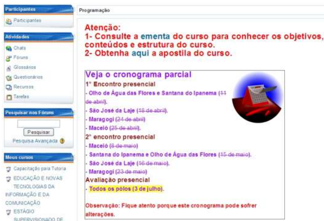
Figura 3. Parte inicial da disciplina com alguns elementos destacados (a ementa, a apostila do curso e as datas dos encontros e avaliações).

No curso também incluímos uma seção de humor no final de cada módulo, em que aparecem reunidos exemplos de humor gráfico sobre o tema das TIC.