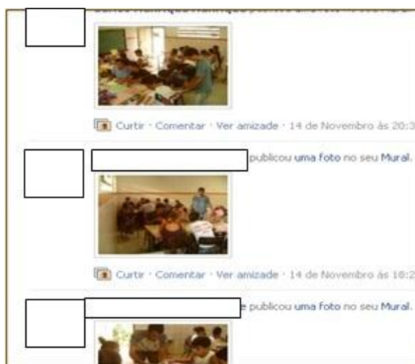
Figura 2 – Experiências desenvolvidas nas escolas

Na proposta observou-se que a quantidade de interações influencia na sistematização dos conteúdos propostos, sendo este um destaque significativo para o uso desta ferramenta online junto aos alunos. O encontro com a diversidade de idéias e apresentação das experiências realizadas nas escolas no período do estágio em que cada aluno foi convidado a desenvolver em sua sala de aula (fig. 2), buscando produzir significados que lhes permitam pesquisar e pensar criticamente. Neste ponto, destaca-se a possibilidade de que alunos-estagiários possam perceber e acompanhar os estágios de outros alunos em outros ambientes (salas ou escolas diferentes), o que não seria possível sem o uso do Facebook , já que a interação pode ser realizada em tempo real. E a possibilidade de se postar conteúdos e comentários via artefatos móveis (smartphones) integra ainda mais os alunos, o campo de estágio e o professor orientador do estágio.