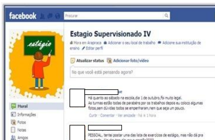
Figura 1 – Tela inicial do Facebook da disciplina Estágio Supervisionado IV

O experimento foi realizado por meio do Facebook (fig. 1) elaborado pelo professor da disciplina, tendo como amostra do projeto experimental os alunos matriculados na disciplina.