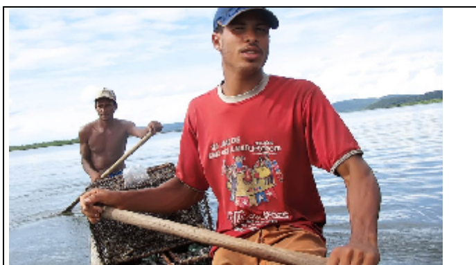
Figura 9: Transporte dos crustáceos.