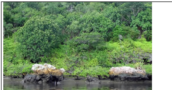
Figura 7: Paisagem da Baía do Iguape.