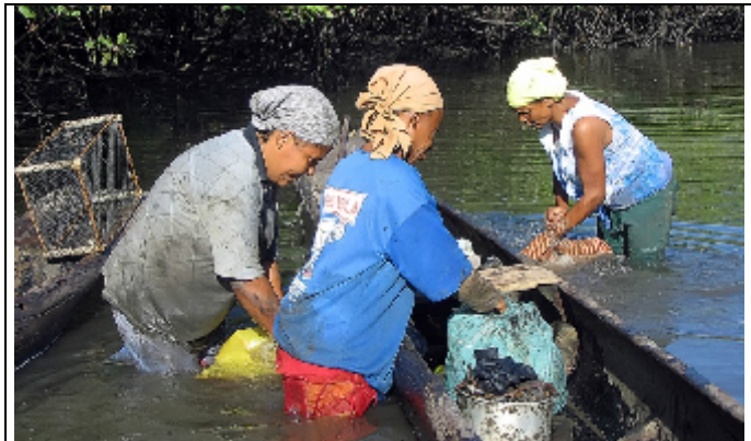
Figura 5: Lavagem dos moluscos.