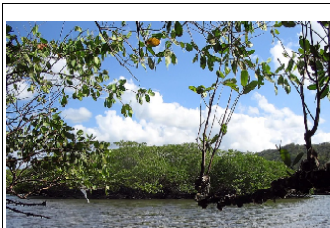
Figura 2: Paisagem do manguezal.

do processo e fotografaram diversos aspectos da mariscagem, entre os quais se destacam as paisagens (figura 2), as ferramentas de trabalho (figura 3), o cotidiano da atividade (figura 4) e a lavagem dos moluscos (figura 5).