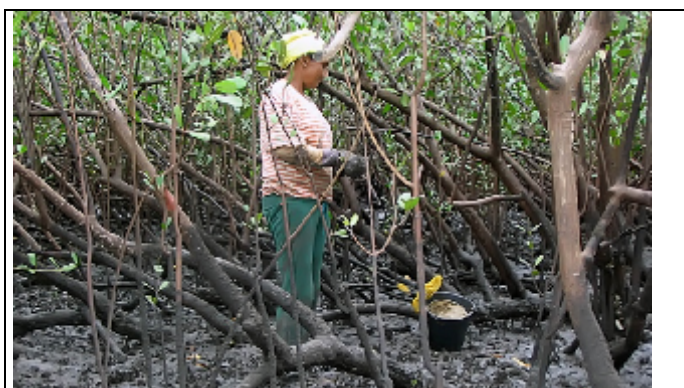
Figura 4: Cotidiano do trabalho.