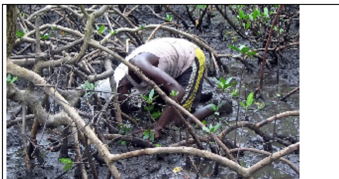
Figura 8: Trabalho de extração.