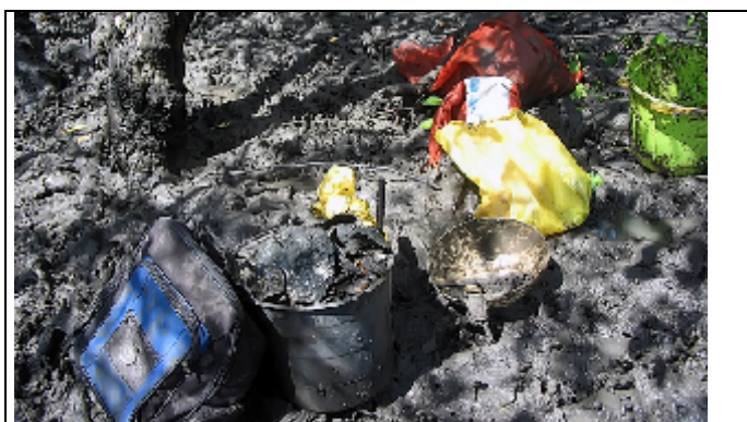
Figura 3: Ferramentas de Trabalho. Autor: Participante da oficina.