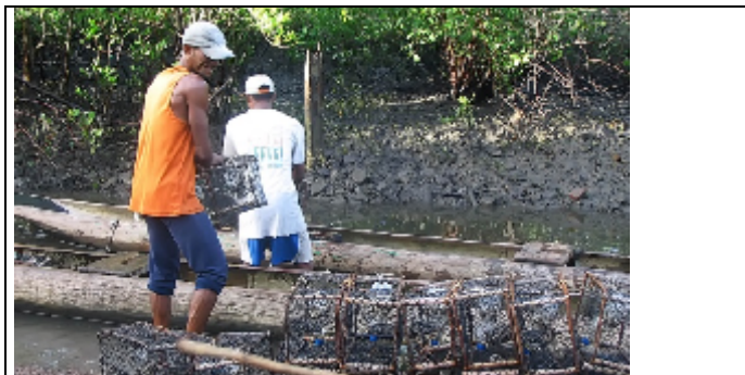
Figura 6: Abastecimento de canoas.

Com os homens, a atividade foi no manguezal Rio do Navio, local onde se extrai caranguejo e siri, em função da especialidade desses trabalhadores. Três rapazes participaram da ação e fotografaram diversas situações da atividade, entre as quais se pode destacar, o abastecimento das canoas no porto no Angolá (figura 6), as paisagens da Baía do Iguape (figura 7), o trabalho de extração (figura 8) e o transporte dos crustáceos (figura 9).