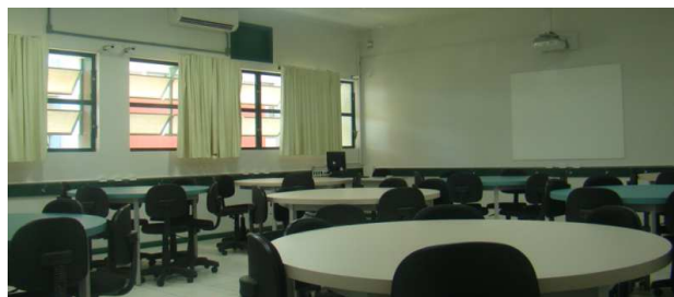
Figura 6: Disposição Sala de Aula.

Os estudantes expuseram como positivo o fato de terem um momento para aprender com seus pares, logo: não foi somente a docente que explicou o conteúdo. Essa forma e até a disposição dos móveis em sala de aula – Figura 6 – auxiliou a interação entre eles na reflexão e troca de experiências acerca do conteúdo abordado.