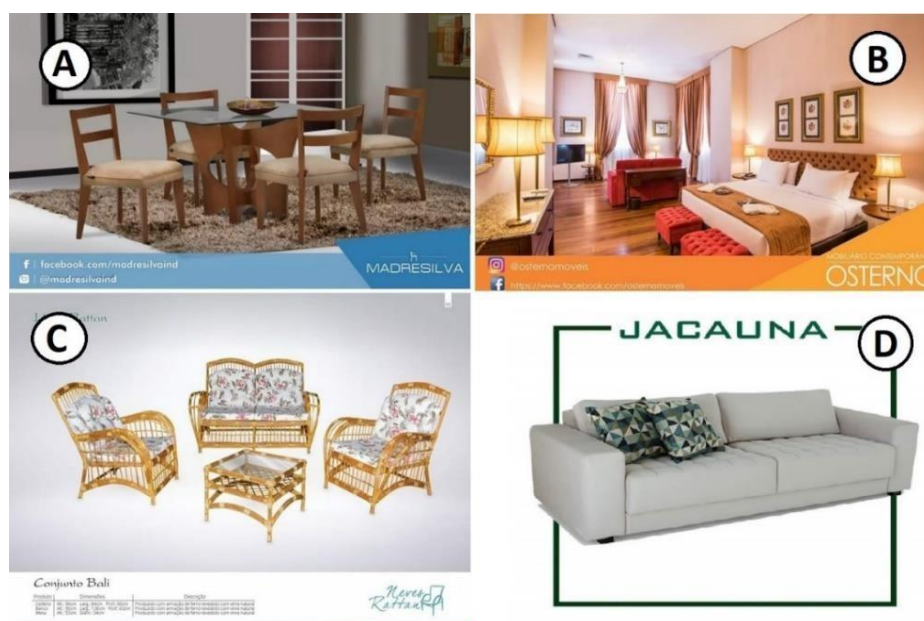
A - Mesa de jantar (Jacaúna); B – Dormitório (Osterno Móveis); C - Conjunto de cadeiras (Neves Ratan); D – Estofados (Jacaúna).