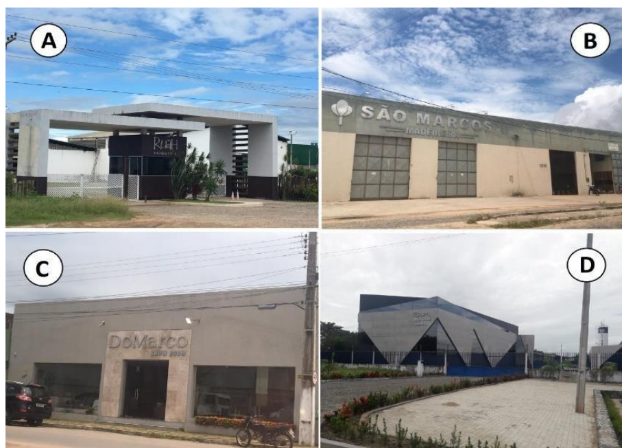
A – Grupo Ruah; B – Madeireira São Marcos; C – Do Marco Móveis; D – Madresilva