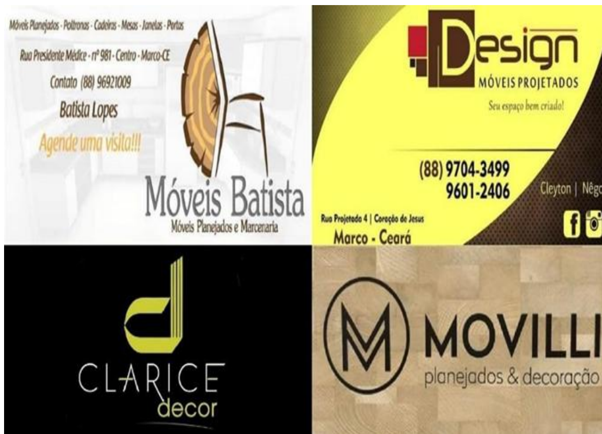
Figura 4 - Logotipos de empresas de decoração da cidade de Marco.