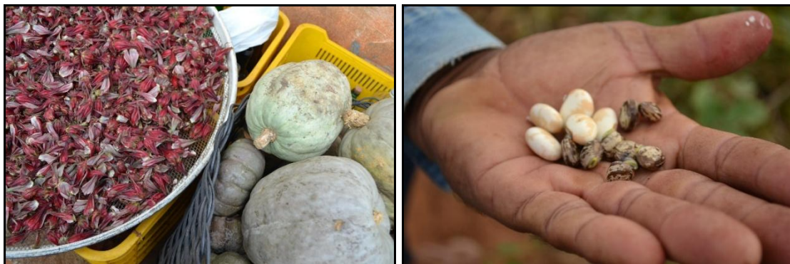
Foto 1 - As Culturas Caatingueiras do Touro

Os caatingueiros vivendo em áreas de solos férteis, porém, com grandes dificuldades hídricas, desenvolveram suas tradições alimentares e habilidades de cultivar plantas mais resistentes às estiagens (Foto 1), como o algodão e diversas variedades de feijões, milho, amendoim, mamona, alguns vinculando as plantações com criações de gado, ou seja, uma grande diversidade, mesmo em um contexto de semiaridez.