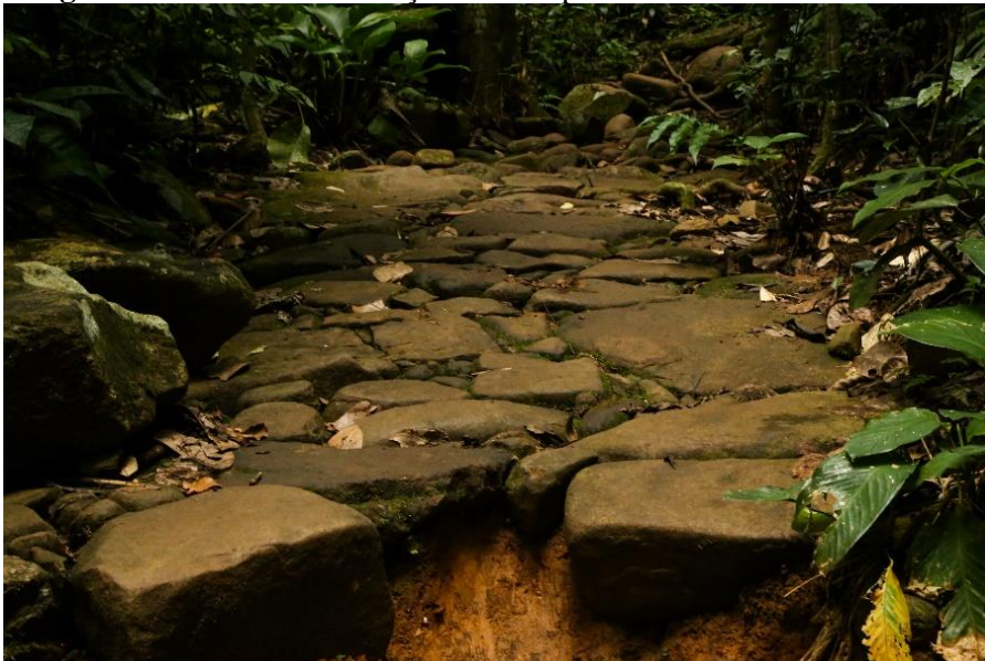
Figura 2 - Caminho com calçamento de pedra no setor Serra da Carioca

Apesar de possuírem enorme capacidade para transitar em caminhos estreitos e declivosos, os animais de carga – a mula, sobretudo – também tinham dificuldade em superar determinados trechos, exigindo intervenções por parte dos trabalhadores. Muros de contenção de encosta, valas de escoamento e principalmente calçamento com pedras nas seções mais acidentadas do trajeto eram imprescindíveis (Figura 2) (BRASIL; OLIVEIRA, 2021). Embora essas medidas fossem necessárias, os trechos calçados de pedra encontrados atualmente são testemunho de um enorme esforço humano, novamente concentrado principalmente na mão de obra escravizada (KROPF; OLIVEIRA; LAZOS-RUIZ, 2020; FERNANDEZ, 2022).