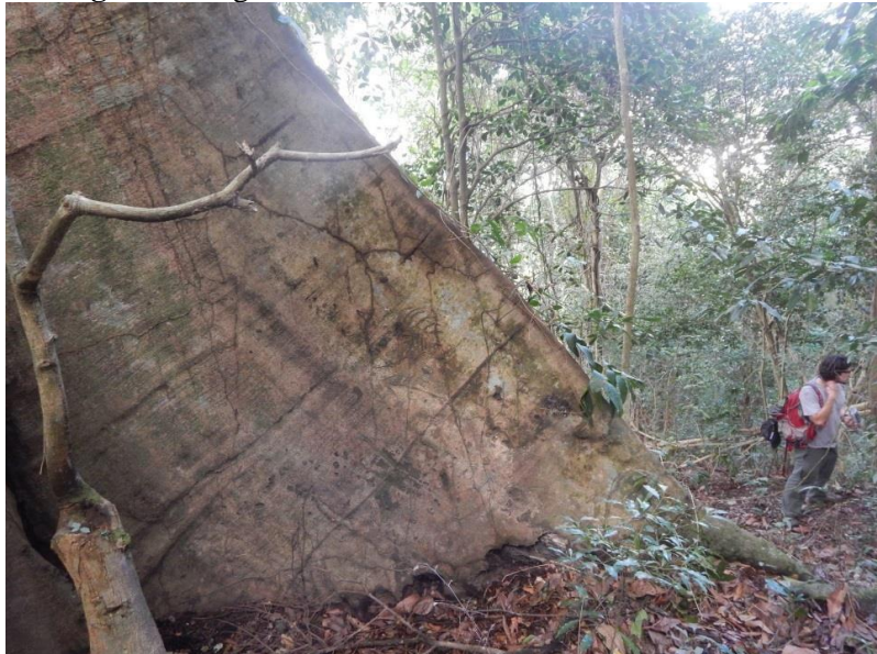
Figura 5 - Figueira remanescente no setor Serra da Carioca

Protegidas por seu simbolismo, as figueiras foram excluídas do processo de seleção das melhores madeiras que seriam aproveitadas para obtenção do carvão. Conseqüentemente, muitas figueiras encontradas na Mata Atlântica são mais antigas do que as outras árvores ao seu redor, sendo remanescentes na paisagem (SVORC; OLIVEIRA, 2012; OLIVEIRA, 2015). São “velhas senhoras” que resistiram ao tempo e às pressões antrópicas ao longo dos anos. Esse simbolismo se materializa na floresta presente no PNT, onde vemos exemplares de figueiras que superam em muito os demais indivíduos arbóreos no seu diâmetro do caule e sua altura total (Figura 5) (FERNANDEZ, 2022; SVORC, 2007).