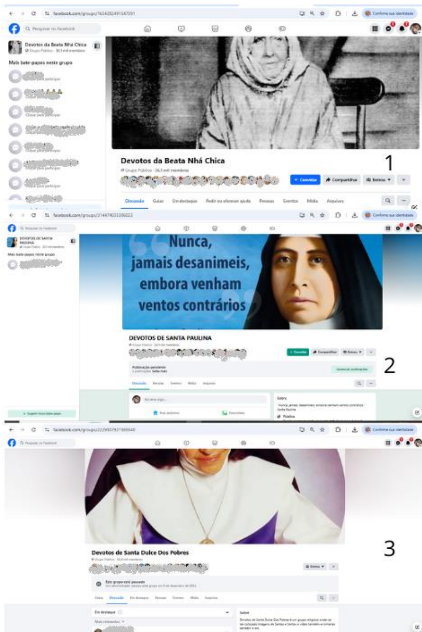
Figura 2 - Páginas do Facebook dos/as devotos/as

Fonte: 1) https://www.facebook.com/groups/1654282491547591 , 2) https://www.facebook.com/groups/314474035306023 , 3) https://www.facebook.com/groups/2229307927365540 Organização: Kelmer (2023)