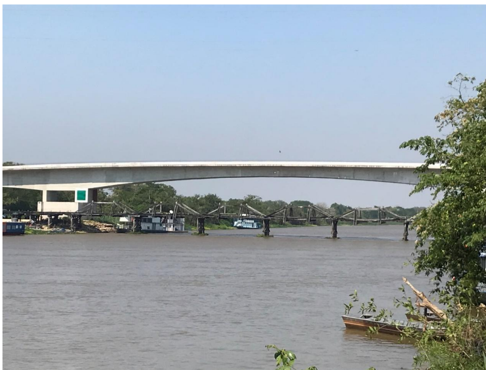
Figura 3 - Ponte sobre o rio Miranda