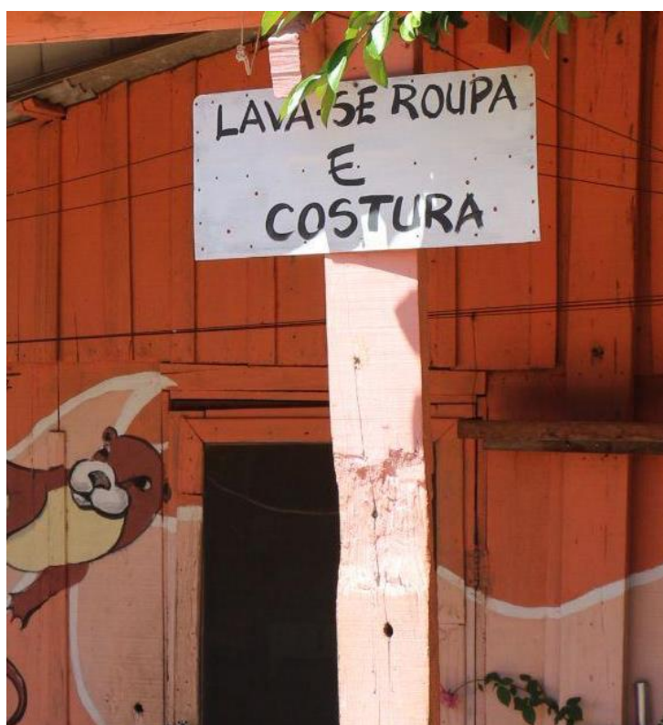
Figura 4 - Exemplo de trabalho doméstico remunerado informal

O trabalho produtivo tem valor de troca no capitalismo, que resulta em bens e são compensados na forma de um salário. Segundo Silvia Federici (2019), o sistema capitalista depende do trabalho não remunerado (doméstico) das mulheres para acumular, mantendo uma relação de dependência entre ambos, em outros termos, o trabalho doméstico em suas diferentes funções intervém para preparar os bens que outros trabalhadores consomem. Como exemplo, o trabalho doméstico remunerado informal pode ser analisado na figura 4.