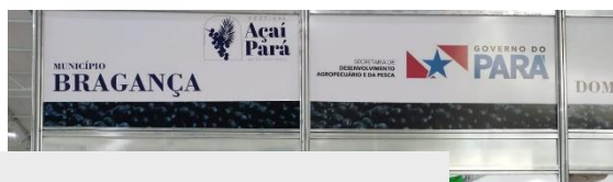
Figura 3: Divulgação da IG reconhecida