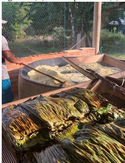
Figura 4 - (A) Processo produtivo e (B) degustação de produtos elaborados com a farinha no Sítio Raiz

entre gerações. Cada visita turística é enriquecida com suas histórias e memórias e o produto com IG, assim como o território produtor, é valorizado.