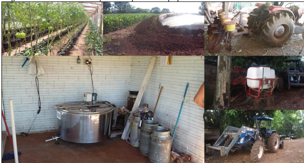
Figura 3: Mosaico da modernização técnica presente nas propriedades rurais

Produção de tomate em estufa; silagem de milho; trator com plantadeira, resfriador de leite; pulverizador e trator.