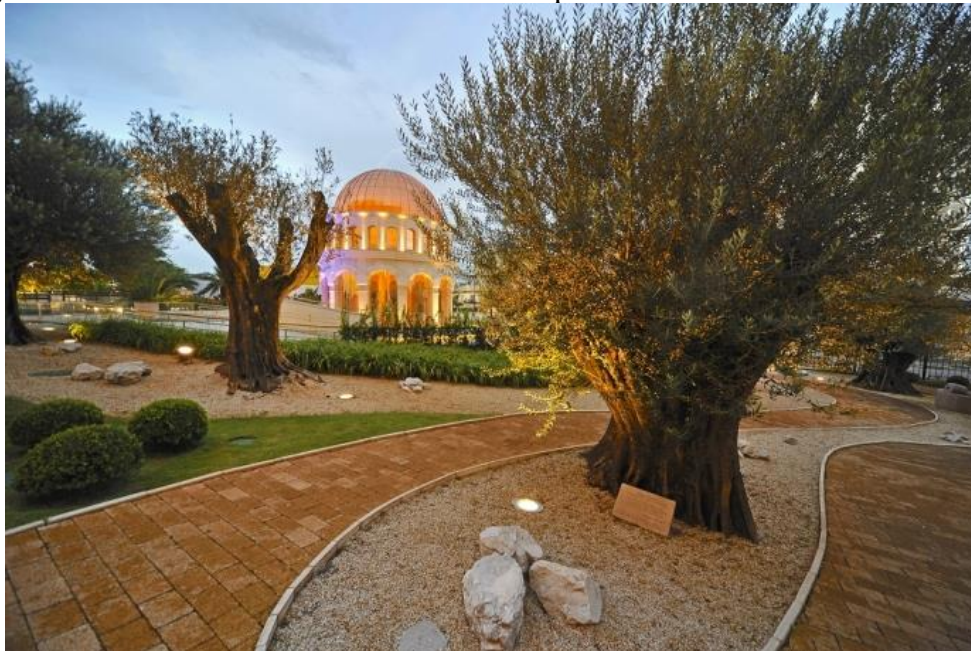
Figura 6: Oliveiras no Jardim Bíblico do Templo de Salomão e Memorial ao fundo

Fonte: DIAS, Rafaela. As Oliveiras no Templo de Salomão. 2016. Disponível em: https://www.universal.org/noticias/post/as-oliveiras-no-templo-de-salomao/ . Acesso em: 27 jan. 2021.