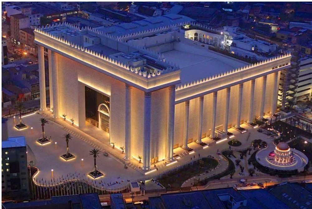
Figura 5: Traçado curvado suave com vegetação remetendo ao clima árido do Oriente Médio