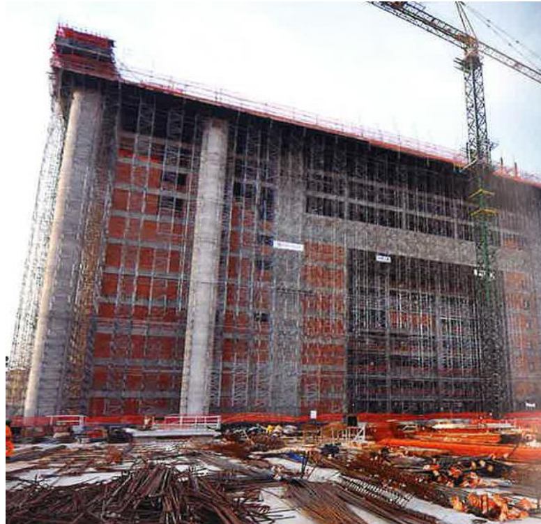
Figura 3: Tijolo baiano e concreto armado na construção do Templo de Salomão no Brás

Fonte: MACEDO, Edir. Minha Biografia: Nada a perder. São Paulo: Planeta, 2014.