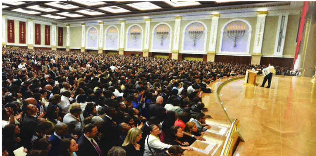
Figura 2: O interior do Templo de Salomão no Brás

Fonte: MACEDO, Edir. Minha Biografia: Nada a perder. São Paulo: Planeta, 2014.