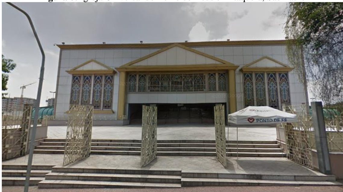
Figura 8: Igreja Universal do Reino de Deus em Itaquera, São Paulo