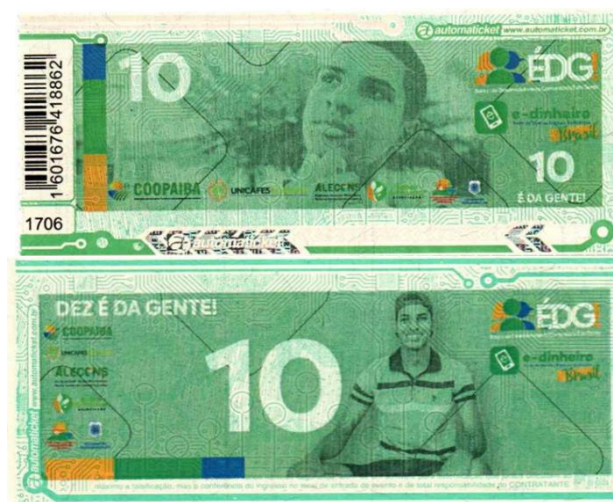
Imagem 13. Anverso e reverso da cédula 10,00 ÉDGs