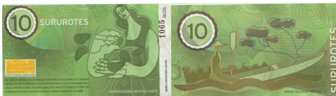
Imagem 8. Anverso e reverso da cédula 10,00 Sururotes