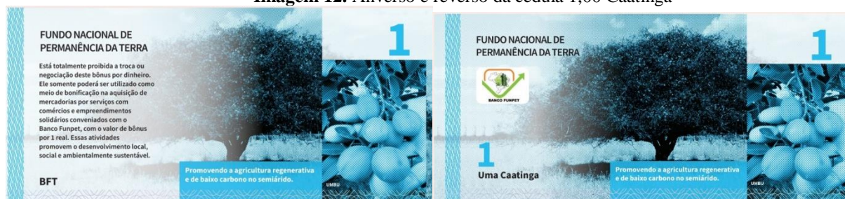
Imagem 12. Anverso e reverso da cédula 1,00 Caatinga