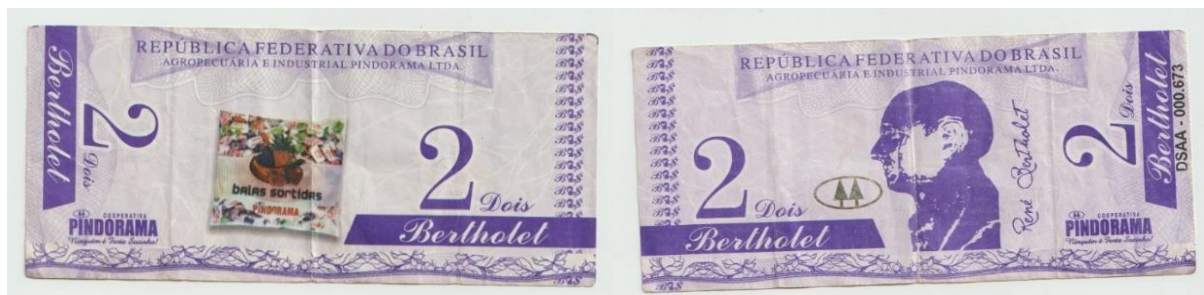
Imagem 7. Anverso e reverso da cédula 2,00 Bertholet