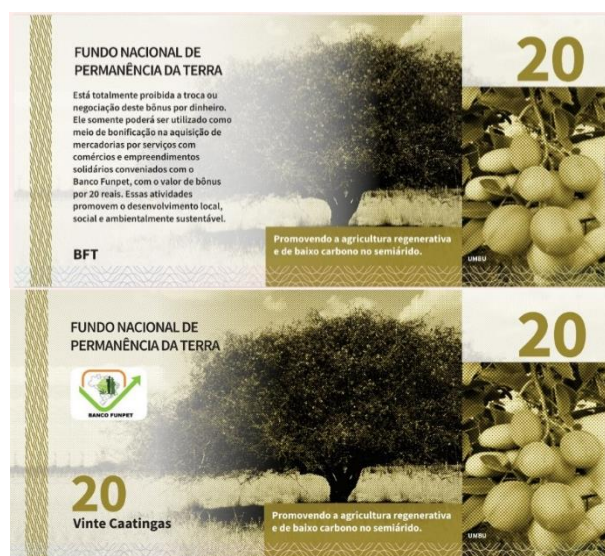
Imagem 11. Anverso e reverso da cédula 20,00 Caatingas