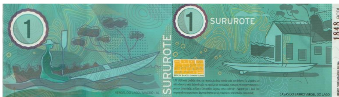
Imagem 10. Anverso e reverso da cédula 1,00 Sururote