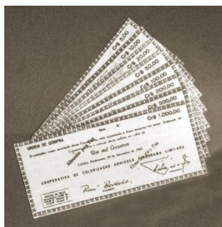
Imagem 6. Moeda Local Gabão da Cooperativa Pindorama, pela data, a primeira do Brasil

Fonte: Moeda “Local Gabão” da Cooperativa Pindorama que circulou de 1962 a 1969 XXIV