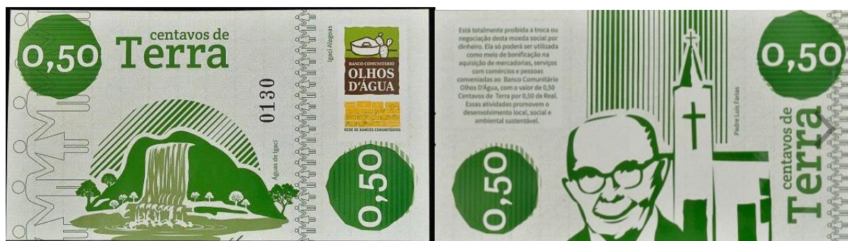
Imagem 1. Anverso e reverso da cédula 0,50 centavos de Terra

Fonte: Moeda Social 0,50 centavos de Terra da cidade de Igaci XI