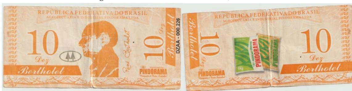
Imagem 4. Anverso e reverso da cédula 10,00 Bertholet's