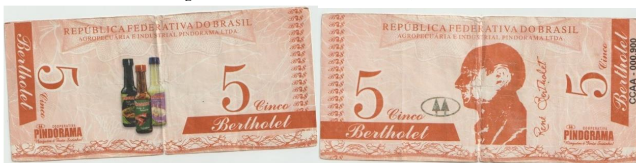
Imagem 5. Anverso e reverso da cédula 5,00 Bertholet