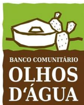
Imagem 3. Identidade visual do Banco Social Olhos D'água da cidade de Igaci.

nas terras do português João de Lima Acioli, que iniciou o povoamento da região em meados do século XIX implantando um sítio de grande desenvolvimento, devido à abundância de água. XIII O banco traz em sua identidade visual símbolos comuns do semiárido: uma cisterna (construção necessária para guardar água da chuva) e uma palma (vegetação inerente ao sertão e semiárido brasileiro). O símbolo do banco está presente do lado direito superior no anverso de todas as cédulas Terra.