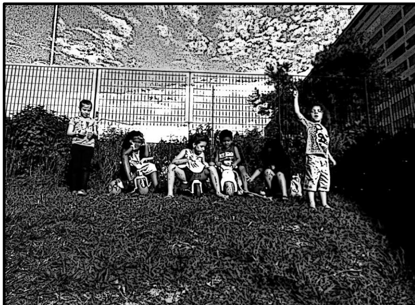
Figuras 5: A colina

quem deixou as crianças descerem a colina de velocípede, mas que rapidamente foi calada com gritos eufóricos de alegria e entusiasmo.