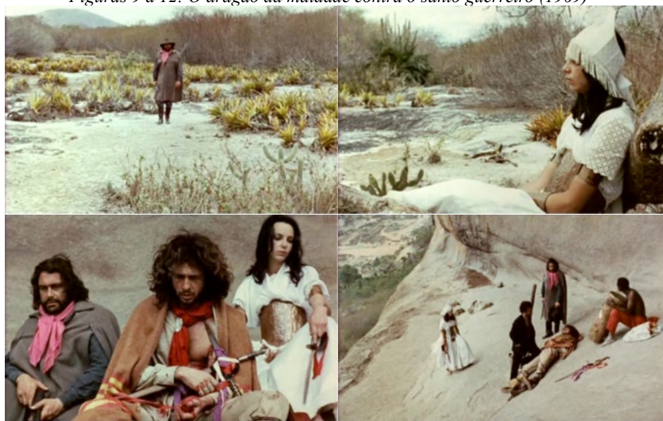
Figuras 9 a 12: O dragão da maldade contra o santo guerreiro (1969) 386

Fonte: https://www.youtube.com/watch?v=xx_QFips7Ow