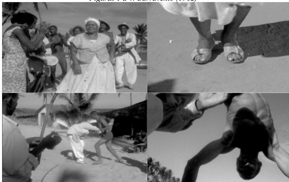
Figuras 1 a 4: Barravento (1962) 382

Fonte: https://www.youtube.com/watch?v=MoV3gsdxVfE