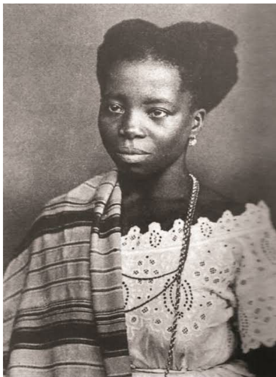
Provável imagem de Hilaria Batista de Almeida, a Tia Ciata