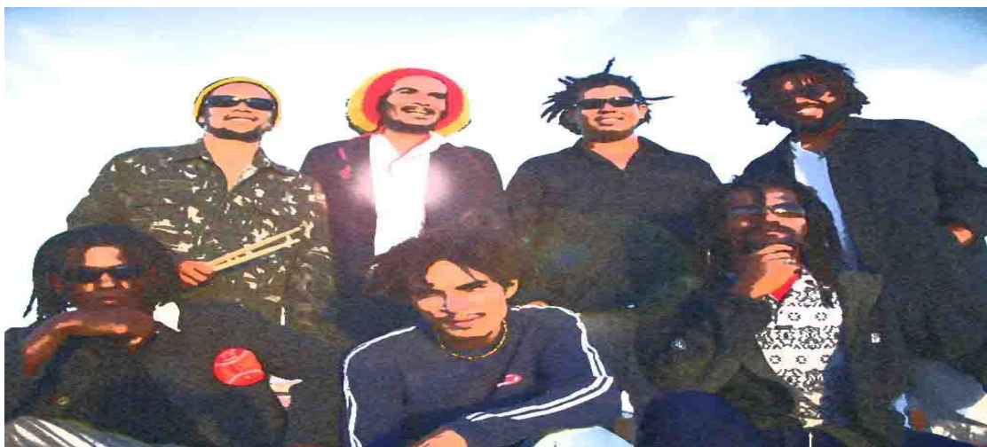
Acervo dos Guerreiros Revolucionários

No ano de 2004, a banda Guerreiros Revolucionários grava seu CD em estúdio, intitulado de Místico Gangae , logo em seguida a banda Reação grava o CD Na força da Fé , cheio de canções que passaram a ser tocadas nas principais rádios locais. As demais bandas seguiram o mesmo caminho e conseguiram realizar gravações de forma independente. Estima-se que entre as bandas que ainda estão ativas e as que encerraram seus projetos, o total é de mais de 50 bandas, a maioria da capital.