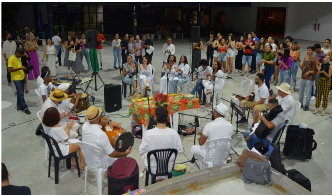
apresentação do projeto “consciência raiz: samba e poesia” na UFS.

Seja como for, o samba segue vivo. Hoje, mais do que nunca, ele serve de contraponto ao discurso de ódio e, através da potência que envolve música, dança e poesia, busca reafirmar vínculos sociais saudáveis, pois a poética do samba tem a capacidade de despertar para uma coletividade crítica e solidária, que torna manifesta a força de uma sabedoria ancestral e uma forma de arte feita pelo e para o povo.