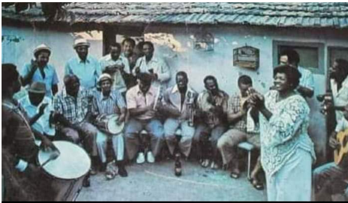
Na foto: uma típica roda de samba com Dona Ivone Lara ditando o ritmo.

Lembremos também das canções do mestre Candeia, que compôs o partido alto Mora na filosofia e fez um disco inteiro dedicado ao tema, o revolucionário Filosofia do samba . A letra de Mora na filosofia nos dá o que pensar: “Pra cantar samba/ Não preciso de razão/ Pois a razão/ Está sempre com dois lados (...)/ Mandei meu dicionário às favas/ Mudo é quem/ só se comunica com palavras”. É por isso que o sambista “não precisa ser membro da academia”, como o mestre Candeia ensinou. Ou seja: temos aqui a chave de outra modalidade de saber e é a isto que eu chamo de sambosofia . É essa forma de saber que está expressa em sambas que carregam a memória, a aprendizagem e o legado das múltiplas vozes que expressam a sabedoria como modo de vida no encontro com o outro: de Zé Ketí a Cartola, de Candeia a Dona Ivone Lara, de Nelson Cavaquinho a Clementina de Jesus, de Monarco a Jovelina Pérola Negra, de João do Vale a Geraldo Filme, passando por Riachão, Dorival Caymmi, Batatinha, Geraldo Pereira, os vários mestres das velhas guardas, além de bambas como Moacyr Luz, Aldir Blanc, João Nogueira, Paulo César Pinheiro, Martinho da Vila, Leci Brandão, Jorge Aragão, o Grupo Fundo de Quintal, Douglas Germano, sem falar nas vozes de Zeca Pagodinho, Clara Nunes, Beth Carvalho, Tereza Cristina, Mariana de Castro, Fabiana Cozza, dentre tantas outras das novas gerações.