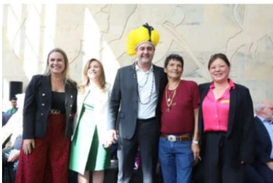
Governador Ratinho Jr comemora el Día de los Pueblos Indígenas, en 19 de abril.

maiores utilizadores de quantidades ilegais de agrotóxicos, maiores responsáveis por catástrofes ambientais, maiores responsáveis pela miséria, pelo analfabetismo etc. etc. etc. Ou seja, a menos que olhemos para esses determinantes geradores de explosões de violência que consideramos do campo ou associados à disputa de terras não tornaremos visíveis os reais assassinos que ficam invisibilizados nos agentes mais explícitos, nos que de fato cometem as tantas violências subjetivas. E estamos chamando atenção para os mecanismos, também muitas vezes nas mãos daqueles que mais lucram com esses conflitos, de invisibilização das reais origens da tão grande violência do nosso campo social; talvez fosse aí que deveríamos procurar os maiores focos de impunidade e não lá onde a violência subjetiva de fato acontece, mas seria preciso inverter o simbólico na massiva mão midiática. E aqui poderíamos traduzir a fala do Detective Lester Freamon do seguinte modo: Você segue os assassinos, você segue os que escravizam, você segue os que usam ilegalmente agrotóxicos, e você eventualmente os prende. Mas você começa a seguir o dinheiro, o agronegócio, o mercado financeiro global propriamente dito, e não sabe onde, a que merda, ele vai te levar.