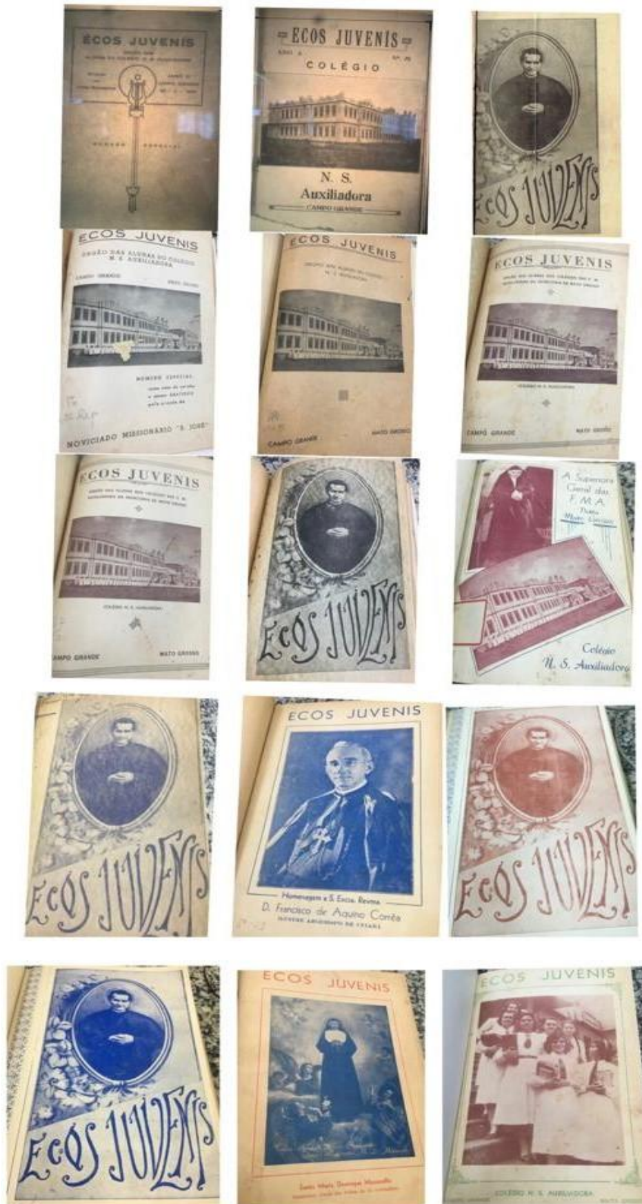
Figura 3 - Capas do Ecoss Juvenis (1936-1951)

Fonte: Centro Documental Regional da Universidade Federal da Grande Dourados (2022) e Biblioteca Pe. Félix Zavattaro - Acervo de obras salesianas da Universidade Católica Dom Bosco (2022).