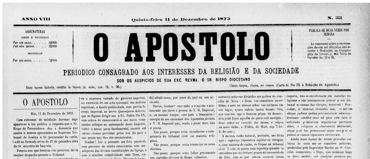
Figura 1: Recorte do jornal O Apostolo