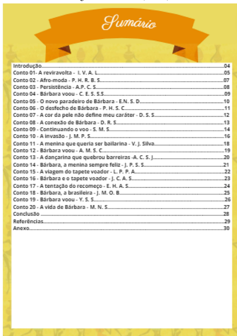
Figura 2 - e-book contos (sumário)