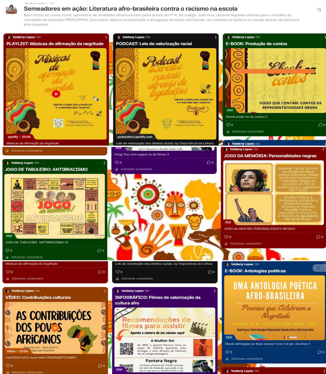
Figura 5 - Mural Virtual: repositório de produções dos alunos