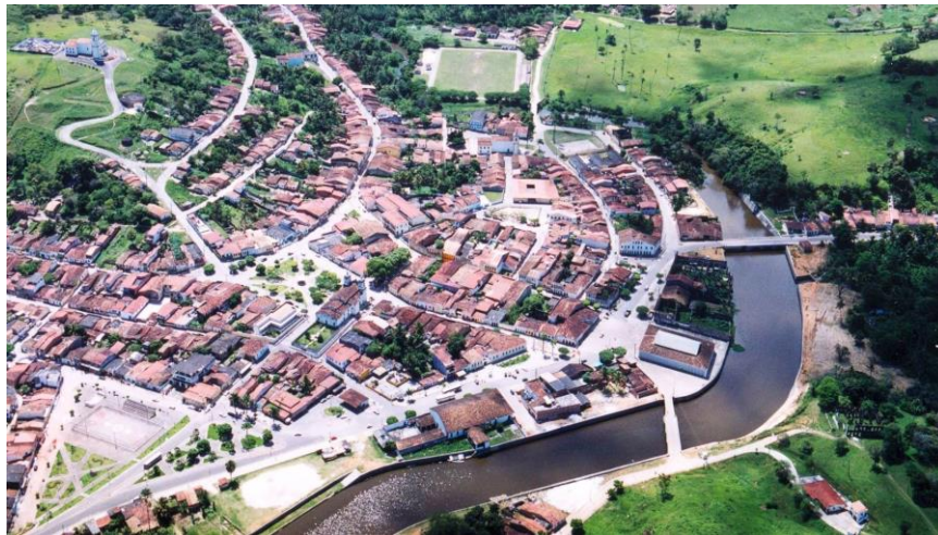
Figura 1: Laranjeiras