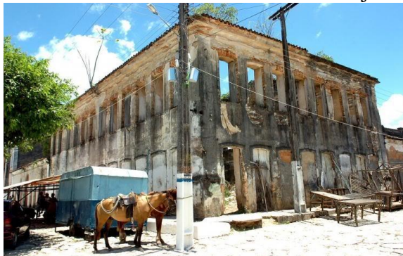
Figura 5: Ruínas do centro histórico de Laranjeiras – SE