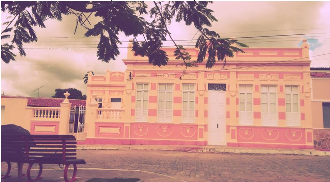
Figura 3: Vila Maroca, Laranjeiras – SE

Em termos arquitetônicos seu destaque estava relacionado aos belos sobrados, imponentes moradias de famílias abastadas e Igrejas do período colonial. Em seu conjunto arquitetônico são observados também pequenos casarios que caracterizam a vida das classes menos favorecidas. As praças, ruas e becos preservam até os dias atuais o traçado original, já alguns edifícios, se encontram em mau estado de conservação, devido a ações naturais do tempo ou mesmo ação humana, além de muitas edificações do patrimônio arquitetônico terem sido destruídas no período de invasão dos holandeses, que transformou Laranjeiras em palco de guerras.