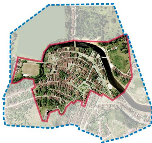
Mapa 1: Perímetro de tombamento do centro histórico de Laranjeiras

De acordo com o IBGE 2013, Laranjeiras possui uma população de 28.533 habitantes, sendo 79% residentes na área urbana e 21% na área rural. Quanto ao IDH (Censo 2010), o município obteve um índice igual a 0,642, considerado médio, colocando o município em décimo lugar no ranking estadual.