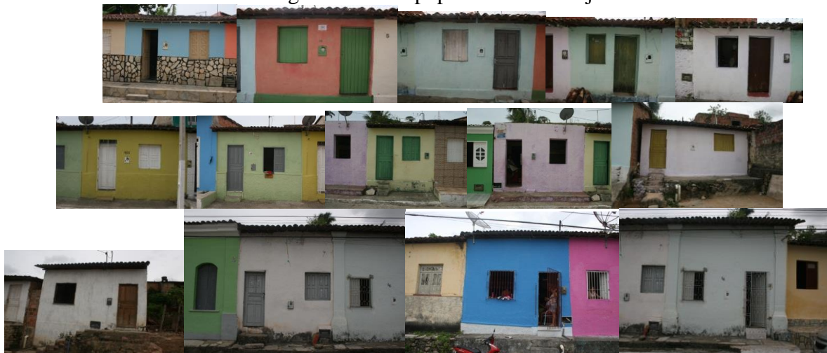
Figura 4: Casas populares de Laranjeiras