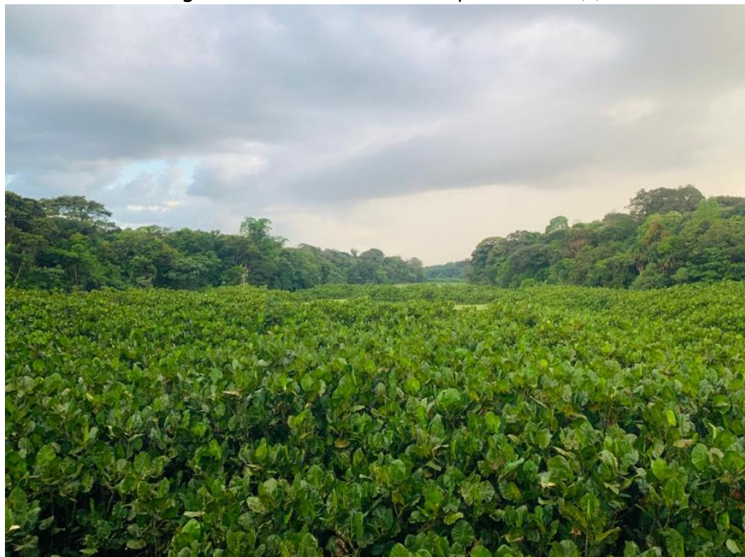
Imagem 04 – Visões da avenida para o PEUT (B).

Acima, temos a visão da Avenida João Paulo II que corta o Parque do Utinga. Ao centro e a frente, a ponte que divide o parque. A partir dessa divisão, observamos, à direita, sua grande extensão territorial densamente verde e, à esquerda, a ilha verde dialogando com as moradias. Abaixo, continuamos refletindo.