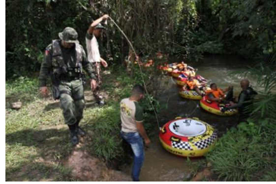
Imagem 08: Acquaride