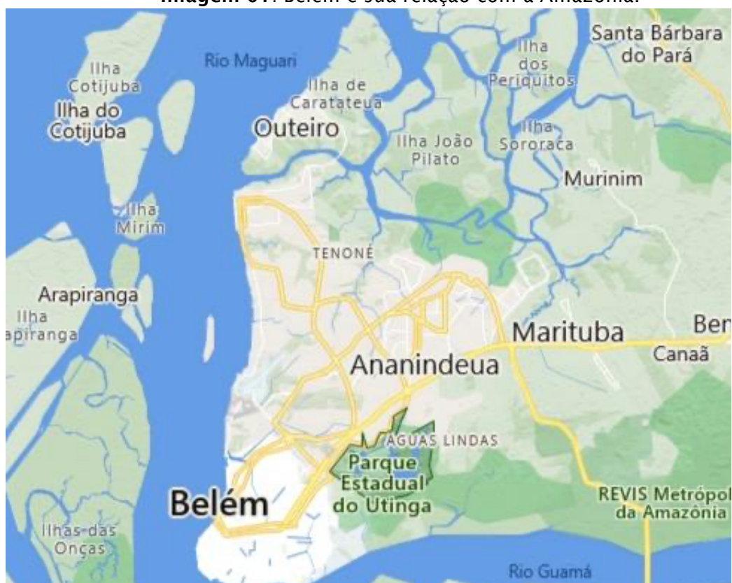
Imagem 01: Belém e sua relação com a Amazônia.