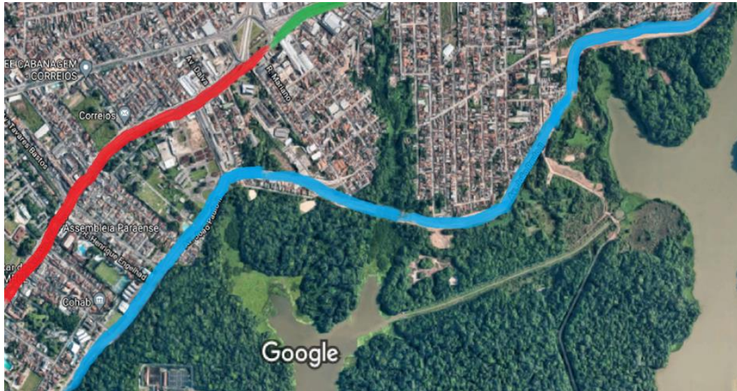
Imagem 02 - O PEUT e as Avenidas.