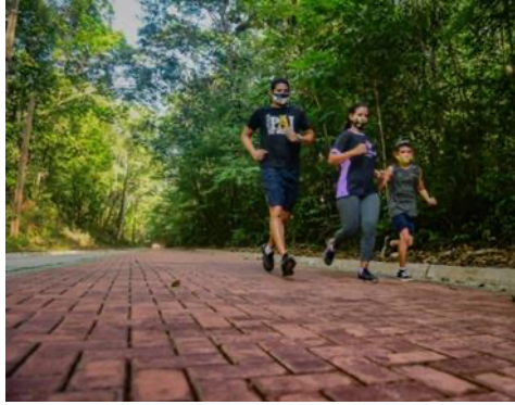
Imagem 07: Corrida e Caminhada