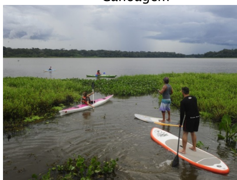
Imagem 05: Stand Up Paddle e Canoagem

Os condutores formados pela AA atuaram no parque estadual do Utinga, onde são desenvolvidas várias práticas de esportes e atividades ligadas à natureza. O parque é de livre acesso a ciclistas, patinadores, caminhantes, corredores, turistas e habitantes locais. No entanto, algumas atividades são organizadas pela iniciativa privada, que é o caso da AA aventura que oferta a condução em percursos terrestres e aquáticos, bem como atividades que envolvem escaladas. Nessas atividades, os condutores consolidam o conhecimento do curso em um período de estágio. Algumas imagens que demonstram essa dinâmica: