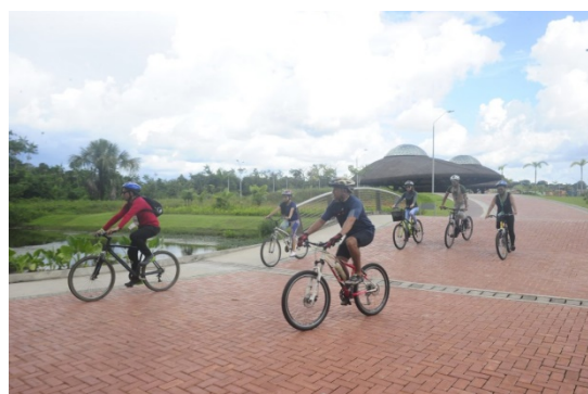
Imagem 06: Ciclismo