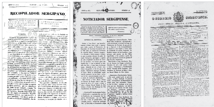
Figura 1: Da esquerda para direita, seguindo ordem cronológica de produção: “Recopilador Sergipano” (1832-1834); “Noticiador Sergipense” (1838); “O Correio Sergipense” (1840-1866).

Fonte: Disponível em: http://objdigital.bn.br/acervo_digital/div_periodicos/recopilador_sergipano/anuario_recopilador.htm ; http://memoria.bn.br/DOCREADER/DOCREADER.ASPX?BIB=711136 ; http://memoria.bn.br/pdf/812544/per812544_1840_00219.pdf