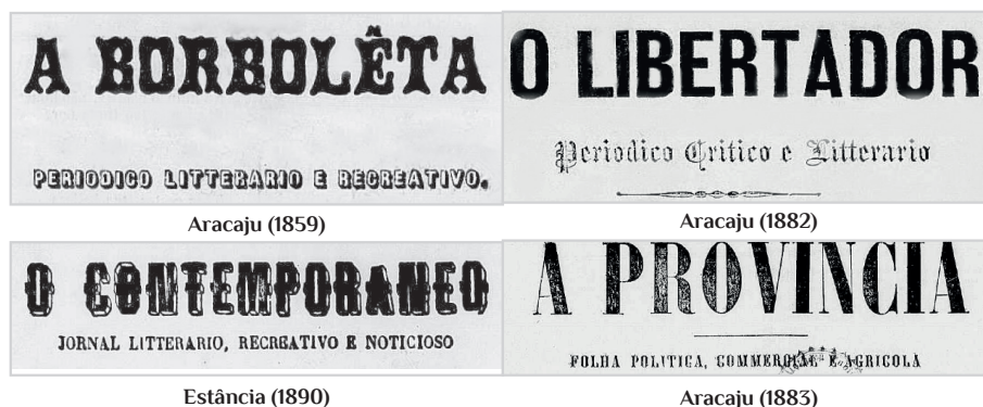
Figura 3: exemplos de títulos de periódicos informacionais de Sergipe Imperial.