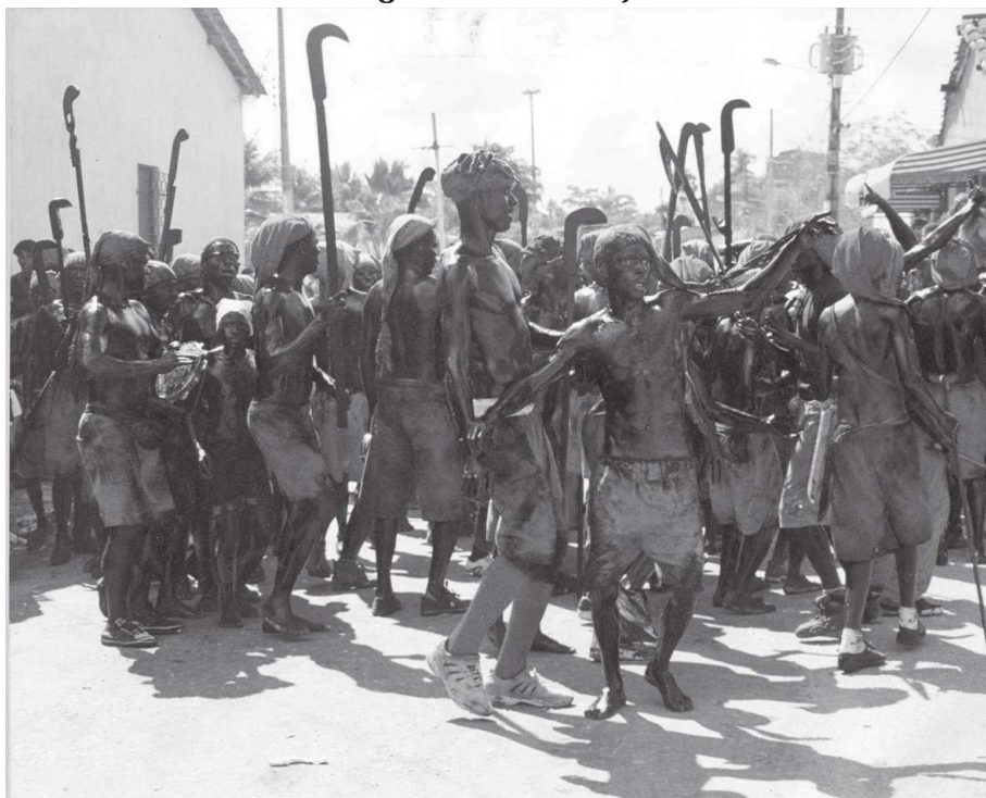
Figura 5. Lambe-sujo