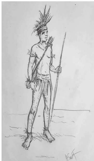
Figura 2. O caboclo - desenho do artista plástico Bené Santana, 2020 21