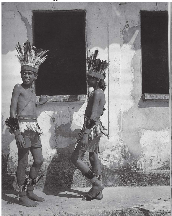
Figura 6. Caboclinhos