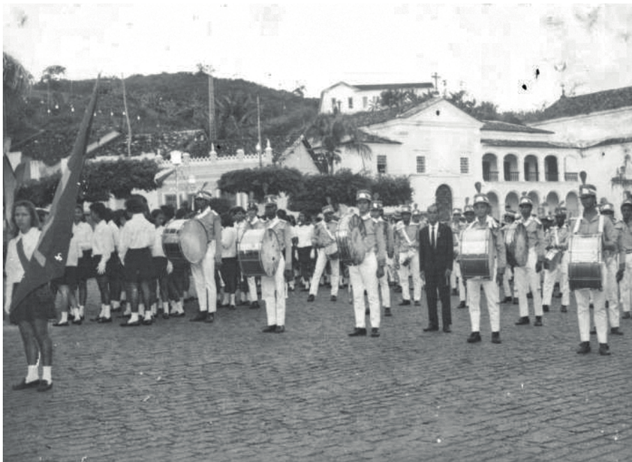
Imagem 3: BAMCEC na Praça da Aclamação.

Sem data. Autor não identificado. Fonte: <facebook.com/photo?fbid=248603735272947&set=a.231834616949859>