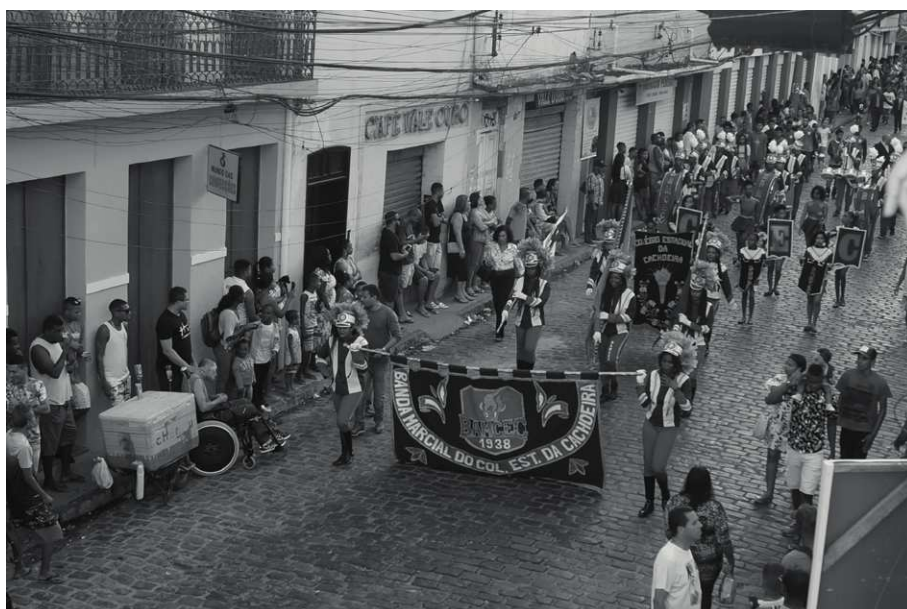
Imagem 4: BAMCEC no desfile de 25 de junho de 2019

Na imagem 4, em fotografia de 2019, a banda está em plena apresentação na rua Prisco Paraíso, a caminho da Praça da Aclamação.