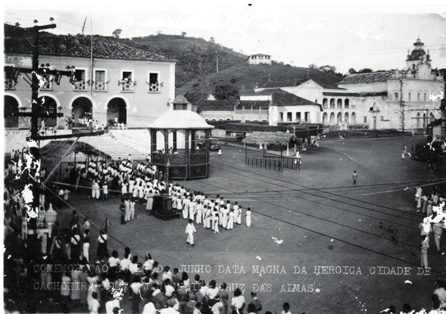
Comemoração do 25 de Junho, em Cachoeira, no ano de 1947, Acervo de J. Nogueira.

Para além dos aspectos da cultura escolar e da visibilidade que essas festas ocasionam, verifica-se que as escolas eram requisitadas a participar das festividades da Independência através de chamados das autoridades municipais. Porém, apesar disso, percebe-se que a preparação para essas celebrações era motivo de orgulho e satisfação para os alunos, como se verá nos relatos a seguir: