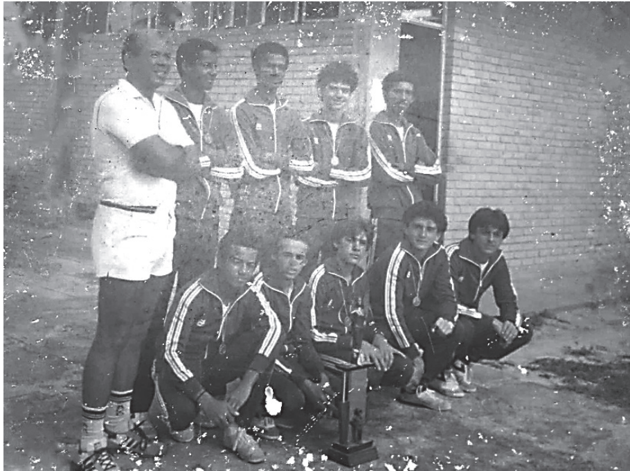
Figura 4 - Equipe de voleibol do Colégio de Aplicação. Categoria B. Campeã nos VIII Jogos da Primavera (1983)