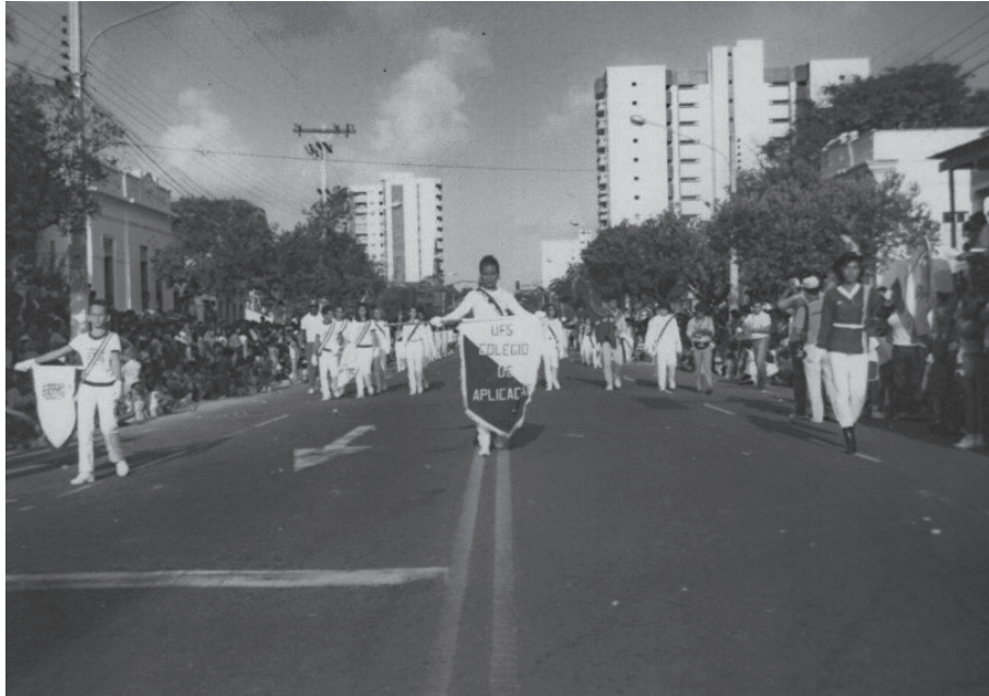
Figura 6: Participação do Colégio de Aplicação no desfile de abertura dos VIII Jogos da Primavera (1983)