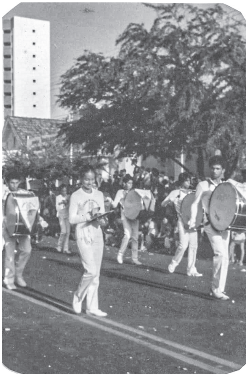
Figura 7: Banda de música do Colégio de Aplicação. Desfile cívico “7 de setembro” (198?)