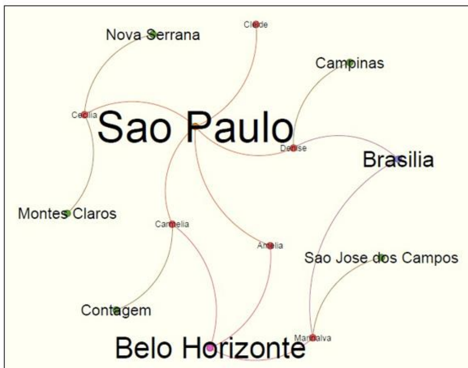
Figura 2 – Sociograma da rota migratória de empregadas domésticas do Norte de Minas Gerais, 2019.