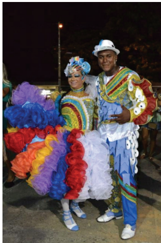
Figura 3: casal de quadrilheiros formado por duas pessoas do sexo masculino.

No cotidiano dos ensaios, eles se vestem com roupas que são associadas ao próprio sexo biológico, porém se utilizam de determinados objetos que são comumente relacionados ao sexo oposto como, por exemplo, bijuterias e maquiagens. No dia da apresentação eles se utilizam dos adereços e vestimentas para comporem o personagem cênico da mulher como mostra a figura abaixo. Dessa forma, poderia se considerar que eles se expressam como homossexuais cross-dressing transtêneros ao passo que vivenciam uma faceta do sexo oposto que está presente na performance da quadrilha junina.