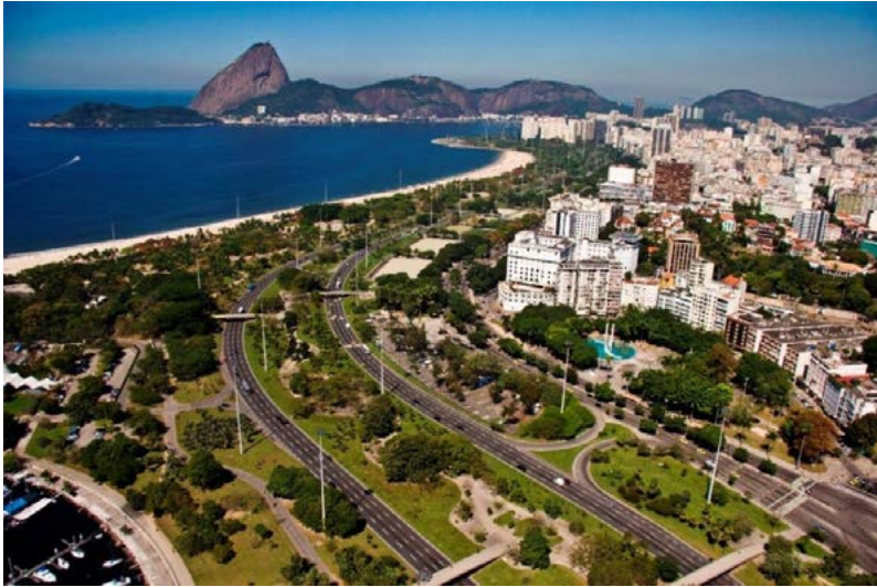
Imagem 01 – Paisagem de poder: Panorama do Parque do Flamengo, bairros da Glória, Flamengo. Ao fundo o morro do Pão de Açúcar.