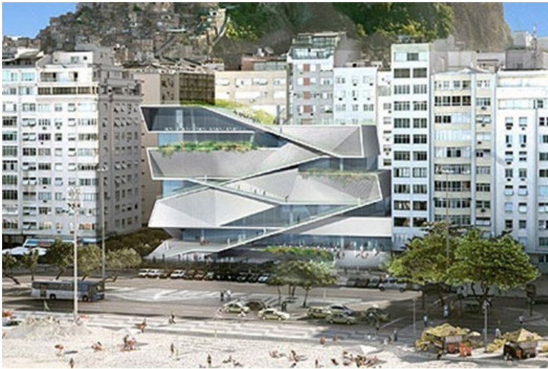
Imagem 04 - Projeto arquitetônico pós-modernista do MIS

gias sustentáveis para a captação de água e energia solar, tentam representar o novo cartão-postal carioca em um tripé pós-modernista das cidades sustentáveis: criativas, culturais, patrimonializadas, pois, além da arquitetura arrojada e diferenciada, propõe-se novos paradigmas de usos sociais dos espaços culturais através do consumo, mídias e tecnologias.