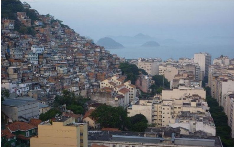
Imagem 02 - A paisagem e a contrapaisagem